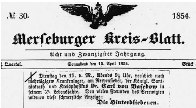
Abb. 10 Todesanzeige von C. A. v. Basedow.

Außer gelegentlichen „Podagra“-Anfällen sind keine Krankheiten von ihm überliefert. Er sei gelegentlich „etwas zerstreut gewesen“ [4] (♣ Abb. 9 ).