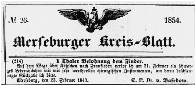
Abb. 9 Verlustanzeige C. A. v. Basedows.