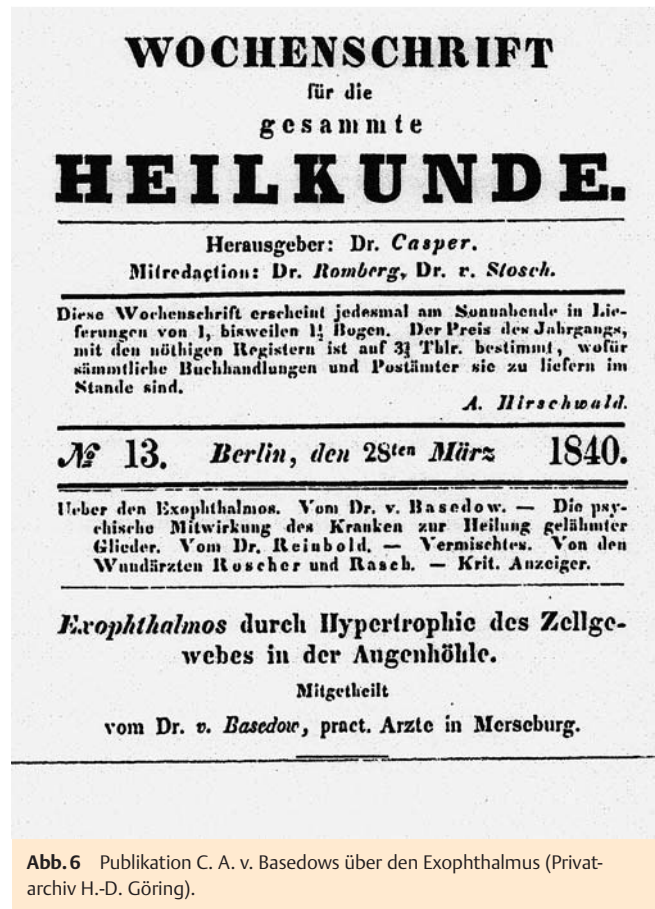
Abb. 6 Publikation C. A. v. Basedows über den Exophthalmus.

Den Exophthalmus erklärte Basedow durch „eine strumöse Hypertrophie des Zellgewebes hinter dem Bulbus“ als Folge einer „erkrankten Circulation und fehlerhaften Crasis des Blutes“ [2]. In späteren Untersuchungen bei Basedow-Patienten beobachtete Albrecht von Graefe 1864 das Zurückbleiben des Oberlides beim Senken des Blickes (Graefesches Zeichen). 1869 beschrieb Karl Stellweg von Carion den seltenen Lidschlag (Stellwagsches Zeichen), und 1883 wurde von Paul Julius Möbius die Konvergenzschwäche (Möbiussches Zeichen) bei Basedow-Kranken erkannt [5]. Friedrich von Müller beobachtete 1893 die allgemeine Stoffwechselsteigerung bei Morbus Basedow und Magnus Levy be-