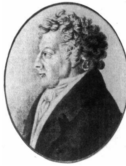
Abb.4 Johann Friedrich Meckel d.J. ( http://commons.wikimedia.org/wiki/File:Johann_Friedrich_Meckel.jpg ).