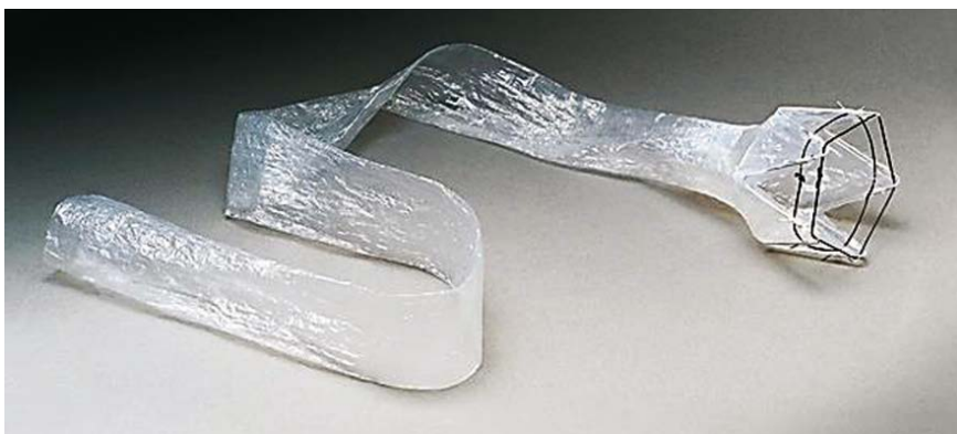
Abb. 1 EndoBarrier® Gastrointestinal Liner.

Allgemeine interventionsassoziierte Ereignisse treten häufig auf. Die häufigsten Ereignisse sind Abdominalschmerzen, Übelkeit, Erbrechen und Diarrhöe, welche gewöhnlich in den ersten Wochen nach Positionierung des Systems auftreten und medikamentös behandelt werden. Die Verankerung im Bulbus duodeni, welche bis in die dort sehr vaskularisierte Submukosa greift, stellt die größte Sicherheit gegen Dislokation, aber auch eine Gefahr für Blutungen und Irritationen dar. Schwere Komplikationen in Form gastrointestinaler Blutungen traten selten auf. Komplikationsbedingt musste das System bei 24% der Patienten frühzeitig entfernt werden. Die häufigsten Gründe dafür sind Migration des Implantats, Blutungen und Obstruktion des Schlauchs. Die Fallzahl in der Literatur wird überwiegend durch Studien mit einem Prototypen geprägt. Durch Erfahrungswerte mit dem Instrument, spezielle Schulung der Endoskopiker, Verbesserung der Befestigungstechnologie und der Lokalisierung der Verankerung, konnten die Komplikationen in neueren