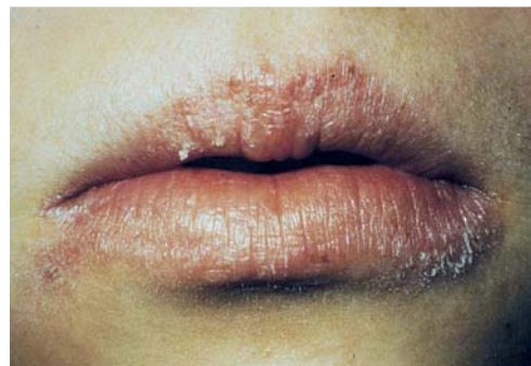
Abb. 3 Paraartefakt: Lippenlecke/kezem.

bzw. in der Interaktion mit fremden Personen erkannt und begriffen wird. Dabei gehen die Dermatosen oft mit einer Entstellung einher oder haben einen für den Patienten bedrohlichen Charakter. Hinzu treten Komobiditäten , Störungen der Krankheitsverarbeitung und Compliance, die durch das Auftreten der Dermatose manifest werden.