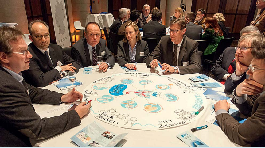
Parlamentarischer Abend in Berlin, DZL-Tisch (Foto: Till Budde).

kussion zwischen den DZG-Sprechern. Die Besucher hatten anschließend die Möglichkeit, in Tischrunden mit Wissenschaftlern ins Gespräch zu kommen und mehr über die einzelnen Zentren und ihre Projekte zu erfahren. Am Tisch „Every breath you take“ erläuterten DZL-Wissenschaftler konkrete Beispiele aus der translationalen Lungenforschung, wie u. a. den Entwicklungsprozess des PH-Medikamentes Riociguat.