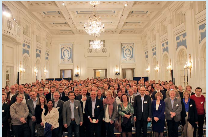
4. DZL-Jahrestreffen im Hotel Atlantic Kempinski in Hamburg.