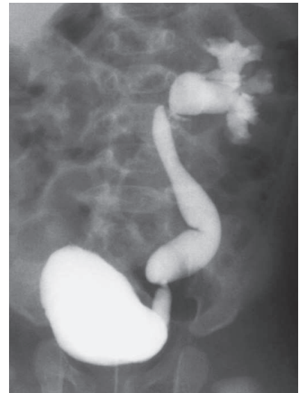
Miktionszystourethrogramm mit Darstellung eines VUR Grad IV links.

Allerdings fand sich bei 87 Kindern, deren erstes Rezidiv von E. coli hervorgerufen worden war, in Rektalabstrichen ein hö-