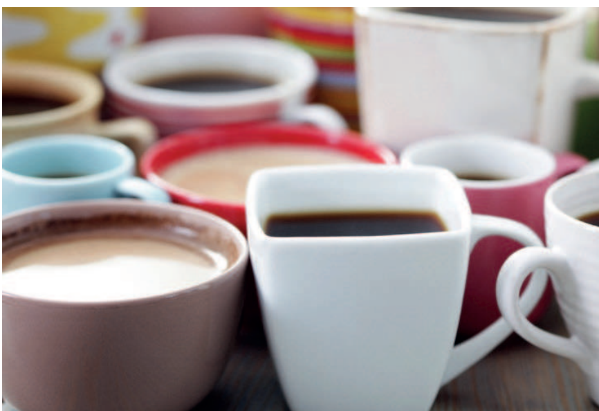
Kaffee führt bei Männern mit chronischem Beckenschmerzsyndrom häufig zu einer Verstärkung der Symptome.