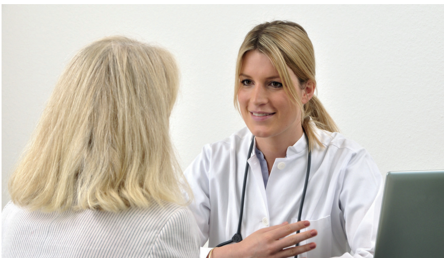
Das Multiple Myelom stellt Patienten und Ärzte immer noch vor große Herausforderungen.