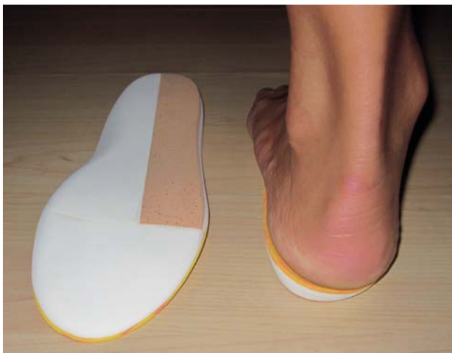
Abb. 1 Einlegesohle mit lateraler Randerhöhung.

gleich zum lateralen Kompartiment. Das Kräfte- und Druckverhältnis zwischen dem medialen und lateralen Kompartiment ist entsprechend der Studien von Agneskirchner et al. [5] und Mina et al. [6] zwischen einem mTFA (mechanischer tibiofemorale Winkel) 0^\circ und 4^\circ valgus ausgeglichen. Bei zunehmend varischer Beinachse steigert sich der Druck medial um ca. 5% pro 1^\circ Achsabweichung [7]. Ebenso spielt die Bandspannung des Innenbands eine erhebliche Rolle. Agneskirchner et al. konnten zeigen, dass nach Open-Wedge-HTO eine ausreichende Entlastung erst nach einem Release von 50% des Innenbands erreicht werden konnte [5].