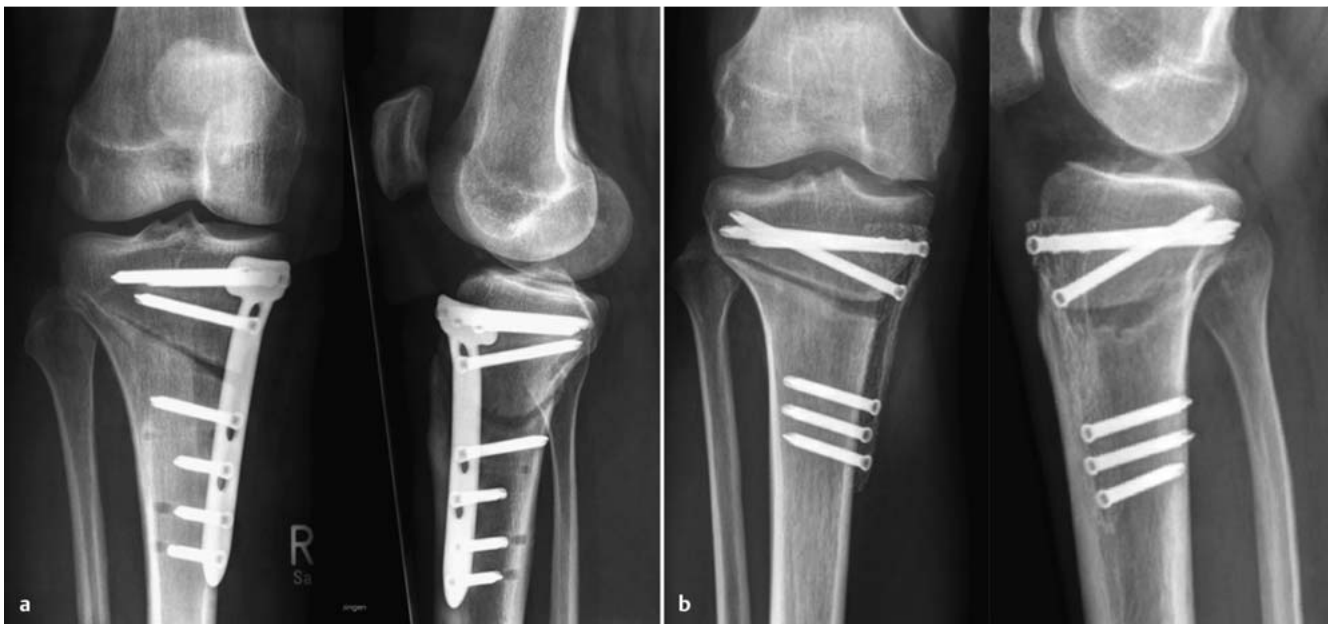
Abb. 3 a und b a Valgisierende Open-Wedge-HTO – mit TomoFix Platte (Synthes®, Umkirch, Deutschland). b Valgisierende Open-Wedge-HTO – mit PEEK Power Plate (Arthrex®, Karlsfeld, Deutschland).

des medialen Kompartiments von 70% im Vergleich zur Messung ohne Orthese. Die Entlastung des lateralen Kompartiments unter Anlage einer Valgusknieentlastungsorthese betrug 46% [22]. Mittels eines implantierbaren Druckmesssystems in die tibiale Komponente einer Knieendoprothese konnte die Arbeitsgruppe von Kutzner et al. diese Daten bestätigen [23]. Die Entlastung hing zudem von der Orthese ab. Bei 4° bzw. 8° valgus konnte eine Reduktion von 24% bzw. 30% des intraartikulären Druckes medial erreicht werden. Beim Treppensteigen hingegen reduzierte sich die Entlastung auf 24 bzw. 26%. Generell ist jedoch bei den Betroffenen die Akzeptanz gering, dauerhaft eine valgusierende Kniegelenksorthese zu tragen [19].