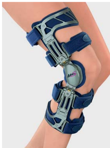
Abb. 2 MEDI® OA BRACE – valgusierende Kniegelenksorthese.