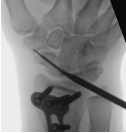
Abb. 7 Eindrehen der Schraube bis zur korrekten Lage unter Bildwandler-Kontrolle.

geführt. Wiederum werden die 3 Ebenen (pa, lateral und Stecher) eingestellt und zusätzlich eine Durchleuchtung mit Unterarmrotation durchgeführt. Hierbei wird v. a. darauf geachtet, dass der Frakturspalt adäquat von der Schraube überbrückt ist und dass weder das proximale noch das distale Ende der Schraube ins Gelenk ragen [6, 12].