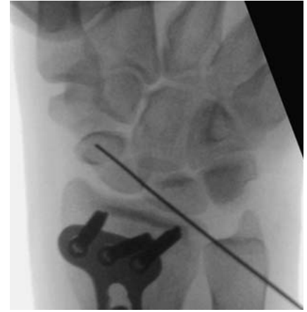
Abb. 3 Zur minimalinvasiven Frakturversorgung wird zunächst ein Kirschner-Draht perkutan von dorsal in den proximalen Skaphoidpol eingebracht und unter Bildwandler-Kontrolle vorgeschoben.

Ausgehend von der radiologischen Diagnostik erfolgt die im klinischen Alltag gebräuchlichste Klassifizierung der Skaphoidfraktur nach Herbert. Diese teilt die Frakturen in die stabilen Frakturformen Tuberkelfraktur (A1) und inkomplette Taillenfraktur (A2) sowie in die instabilen Schrägfrakturen (B1), dislozierten Frakturen der Skaphoidtaille (B2), die immer hochgradig instabilen Frakturen des proximalen Pols (B3) und die transskaphoidalen Luxationsfrakturen (B4) ein [5]. Mit routinemäßiger CT-Diagnostik in korrekter Schnittführung konnte gezeigt werden, dass inkomplette Frakturen beim Erwachsenen nicht vorkommen, sodass die A2-Fraktur als unverschobene Fraktur der Skaphoidtaille neu definiert wurde [9].