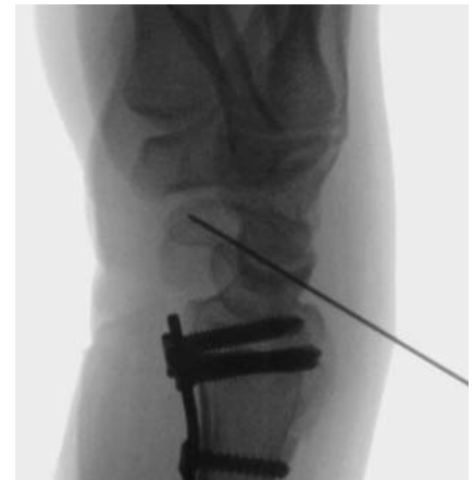
Abb. 4 Die korrekte Lage wird zunächst in zweiter Ebene sowie zusätzlich durch vollständiges Drehen des Unterarms unter dem Bildwandler kontrolliert.