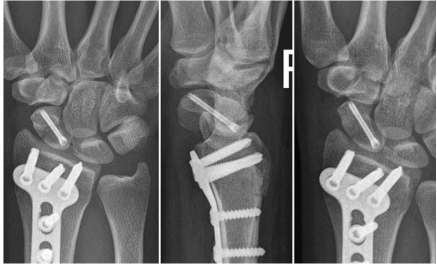
Abb. 8 In der postoperativen Röntgenkontrolle wird die postero-anteriore (links) und die laterale Aufnahme (Mitte) ergänzt durch die Aufnahme nach Stecher (rechts).

Für den dorsalen, minimalinvasiven Zugang wird unter BV-Durchleuchtung der proximale Skaphoidpol am Dreieck zwischen radioskopoidalem und skapholunärem Gelenkspalt mit einem Führungsdraht der geplanten Mini-Doppelgewindeschraube aufgesucht. Die Eintrittsstelle in die Haut liegt dabei immer überraschend weit ulnar. Der Draht wird ins Skaphoid vorgebohrt, seine Lage wird wieder mit BV in den 3 Standardebenen des Skaphoids und unter Durchleuchtung bei Unterarmrotation kontrolliert. Bei korrekter Lage wird die Haut um den Draht herum auf etwa 0,5 cm inzidiert und dann eine selbstschneidende Mini-Doppelgewindeschraube eingedreht. Beim Eindrehen wird eine Berührung der Schraube mit der Haut sorgfältig vermieden. Die Schraubenlänge lässt sich hier nicht messen, sondern nur schätzen, wobei die Schraube in der distalen Spongiosa immer so gut hält, dass sie eher etwas zu kurz als zu lang gewählt werden sollte. Üblich ist eine Schraubenlänge zwischen 20 und 22 mm. Die Abb. 1 bis 8 zeigen ein Fallbeispiel einer minimalinvasiven Skaphoidosteosynthese von dorsal mit Ausschnitten der präoperativen Diagnostik, Aufnahmen der operativen Versorgung und postoperativer Kontrolle.