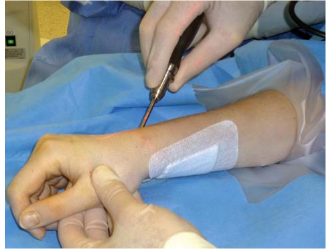
Abb. 6 Einbringen der selbstschneidenden, kanülierten Mini-Doppelgewindeschraube über den Führungsdraht.

Nach 6 Wochen erfolgen die Abnahme des Skaphoid-Casts und die radiologische Kontrolle, unbedingt mit Stecher-Aufnahme. Ist eine ausreichende Konsolidierung der Fraktur nicht sicher nachweisbar, ist die Kontrolle der Frakturheilung durch CT indiziert.