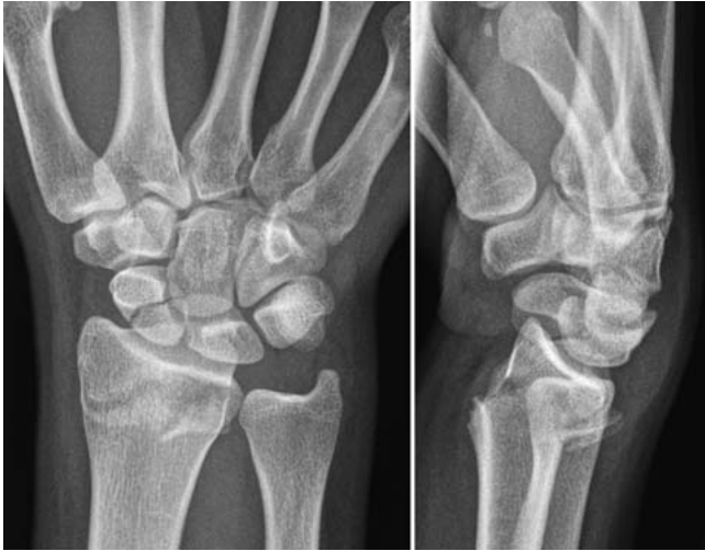
Abb. 1 Fallbeispiel: 19-jährige Patientin mit Radiusfraktur und begleitender Skaphoidfraktur rechts nach Hochrasanztrauma. Die gezeigten initialen Nativröntgenaufnahmen (pa und lateral) lassen eine genaue Beurteilung der Skaphoidfraktur nicht zu.