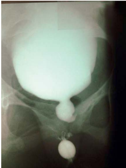
Abb. 5 MCU anterior posterior.