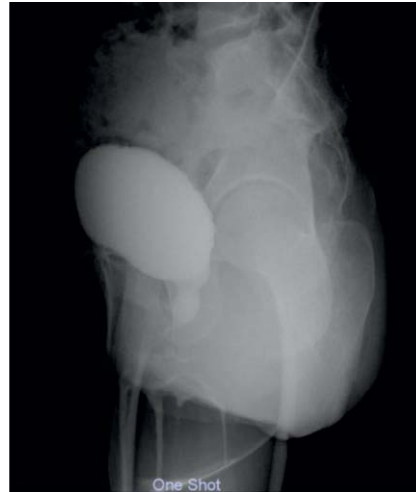
Abb. 6 MCU lateral.

Auflösung des Mesenchyms am Blasenhal oder der Einschluss abnormaler Mengen von nicht muskulärem Bindegewebe mit dem Ergebnis eines hypertrophierten glatten Muskels, fibröser Kontrakturen und entzündlichen Veränderungen.