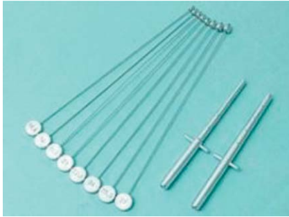
Abb. 3 Bougie à Boule und Harnröhrenbougie.