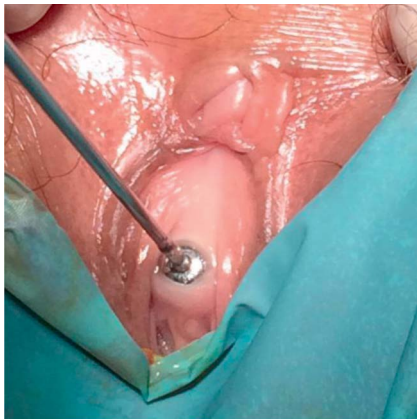
Abb. 4 Nachweis einer Harnröhrenstriktur durch Harnröhrenkalibrierung (V.a. Lichen sklerosus).