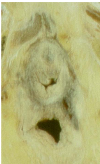
Abb. 2 Anatomischer Querschnitt (fixiert) durch die weibliche Harnröhre und Vagina.

zirkuläre Schicht. Das letzte Viertel der Urethra ist minimal steuerbar, dort enden die Muskelschichten in einem dicken kollagenen Ring, eine Verdickung, die auch bei jungen Mädchen als Lyon Ring (Lyon und Tanagho 1965) bezeichnet wird, der für Blasenentleerungsstörungen und rezidivierende Infekte verantwortlich sein soll [1] (• Abb. 1 ).