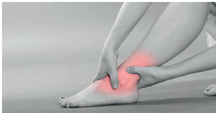
Die Autoren empfehlen eine Kombination sensibler und spezifischer Zeichen, Symptome und Tests, um eine Beteiligung der Sprunggelenk-Syndesmose zu bestätigen.

Obwohl die Ergebnisse zeigen, dass kein einzelner Test verlässlich genug für eine Diagnose ist, empfehlen die Autoren eine Kombination sensibler und spezifischer Zeichen, Symptome und Tests, um eine Beteiligung der Sprunggelenk-Syndesmose zu bestätigen. Eine Unfähigkeit zu hüpfen und zu gehen sowie Druckdolenz der Syndesmose und Dorsiflexion-external-Rotation-Stresstest (sensitiv) könnten mit „Schmerz, der in keinem Verhältnis zur sichtbaren Verletzung steht“ und dem Squeeze-Test (spezifisch) kombiniert werden, um das Verdachtsniveau für die Verletzung der Sprunggelenk-Syndesmose zu erhöhen.