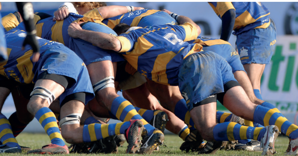
Rugby ist ein Sport mit erhöhtem Kopfverletzungs-Risiko.

Diese Pilotstudie liefert die ersten vorläufigen Schätzungen der Leistungsfähigkeit des IRB-PSCA-Tests, die auf eine mögliche günstige Balance zwischen positiven und negativen prädiktiven Werten hinweisen. Die Ergebnisse bieten eine gute Grundlage, eine weitere, größere Studie zu entwerfen und durchzuführen – so die Autoren. Eine akkurate Beurteilung von Kopfverletzungen kann die Anzahl von Spielern, die mit einer erst nachfolgend festgestellten Gehirnerschütterung auf das Spielfeld zurückkehren, wesentlich verringern.