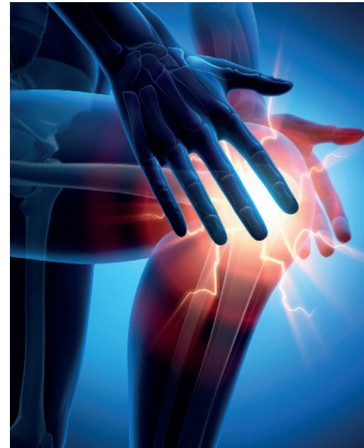
Aufgrund der hohen Inzidenz einer ACL ist eine Verbesserung der Präventionsstrategien nötig.

Der Einsatz von Anweisungen, die einen externen Fokus bewirken, hat hingegen einen wichtigen Einfluss auf die Prävention von ACL-Verletzungen aufgrund der hohen Retentions- und Transferrate des externen Fokus. Eine bessere Landetechnik nach einem Sprung muss während des Trainings oder Spiels automatisch erfolgen – eine Automatisierung des Transfers von der Übung zur Anwendung ist somit von hoher Wichtigkeit.