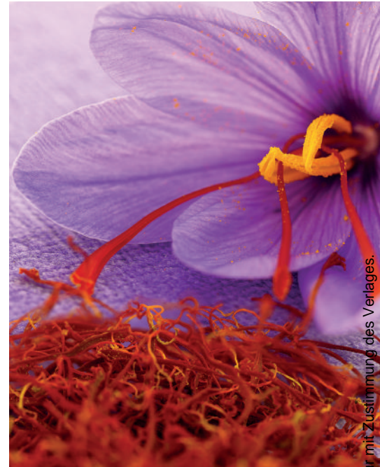
Safran hat sowohl auf die Prävention von DOMS als auch auf die Steigerung der Muskelkraft einen positiven Einfluss.

Die Safrangruppe berichtete über keine Schmerzen, wohingegen die Teilnehmer der Indometacingruppe 72 h nach der sportlichen Aktivität Schmerzempfinden zu Protokoll gaben ( P < 0,001 ). Dies sehen die Autoren in der entzündungshemmenden und antioxidativen Wirkung des Safrans begründet.