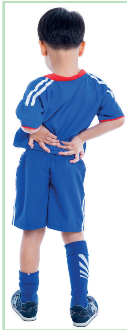
Rückenschule und Übungen können die Episoden von Rückenschmerzen bei Kindern reduzieren.

Bei jedem Besuch wurde eine Rückenschulung durchgeführt, wobei den Schülern Angewohnheiten und Prinzipien vermittelt werden sollten, um die Wirbelsäule gesund zu halten. Der Interventionsgruppe wurden zusätzlich noch 4 einfache Übungen gezeigt, die eine