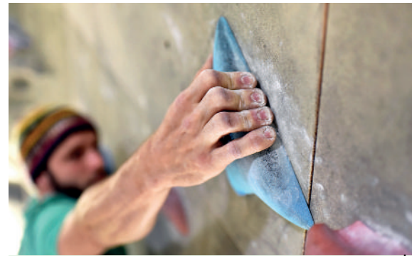
Beim Sportklettern kommt es am häufigsten zu Verletzungen der Finger.

Über die 12-monatige Nachbeobachtungszeit traten insgesamt 267 neue Verletzungen bei 180 Kletterern auf (42,2%), entsprechend einer Inzidenz von 13,04 pro 1000 Kletterstunden.