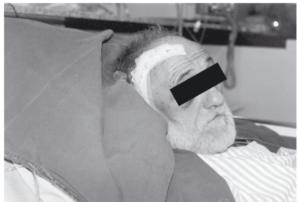
Figura 6 – Paciente no segundo dia de pós-operatório.