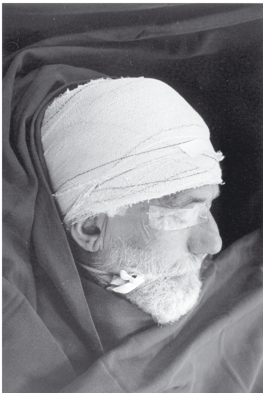
Figura 4 – Paciente com curativo completo.