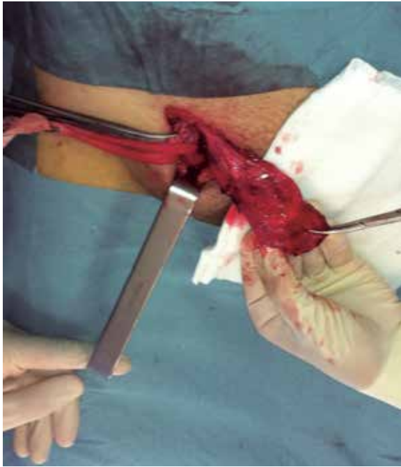
Figura 3 – Isolamento do saco herniário com o cateter no seu interior.

O doente teve alta hospitalar no dia seguinte com melhora da dor referida à fossa ilíaca direita e resolução da agitação psicomotora. Após seis meses de follow-up , a esposa refere melhora significativa do comportamento do doente, sem novos episódios de agitação ou passagem pelo serviço de urgência.