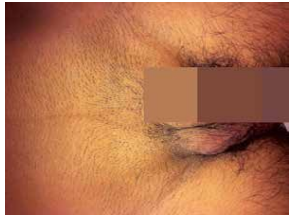
Figura 1 – Tumefação inguino-escrotal à direita. À palpação era possível notar estrutura tubular enrolada correspondente ao cateter abdominal.

O doente foi operado na semana seguinte, conjuntamente com cirurgia geral. Foi removido o saco herniário que continha o cateter (desconectado) enrolado em seu interior, bem como a ponta do outro cateter funcional (Figuras 3 e 4). Procedeu-se ao reposicionamento do cateter no interior da cavidade abdominal e hernioplastia com colocação de prótese Progrid® autoadesiva.