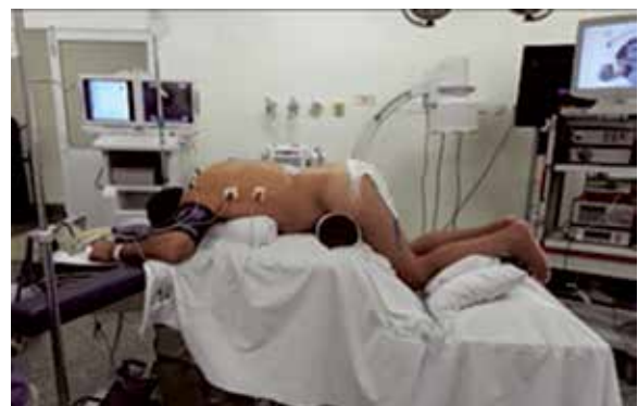
Figura 1 – Posicionamento cirúrgico.

Realizar marcação radioscópica em dois planos, identificando nível objetivado. 2