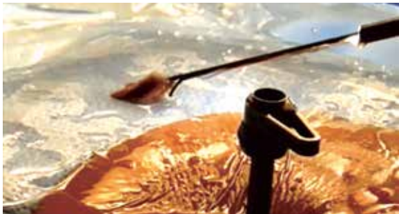
Figura 9 – Retirada da hérnia em conjunto com a óptica.