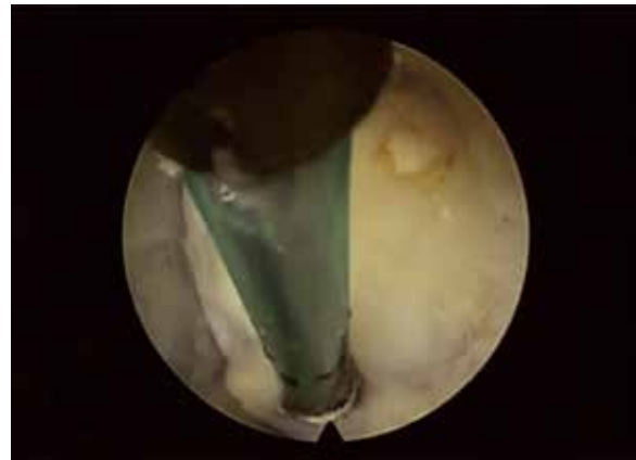
Figura 5 - Dissecção do ligamento amarelo com bipolar Triquer-Flex.