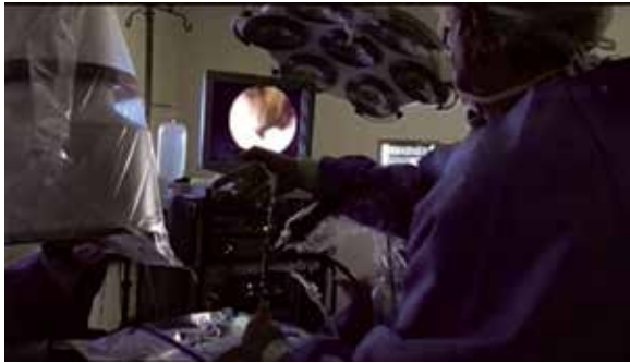
Figura 8 – Movimento de joystick.