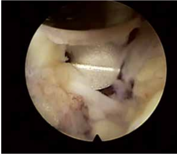
Figura 7 – Saca-bocado para ampliar janela.