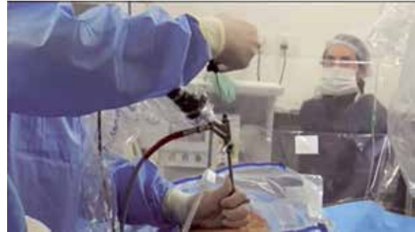
Figura 4 - Óptica no canal de trabalho com início do procedimento cirúrgico.