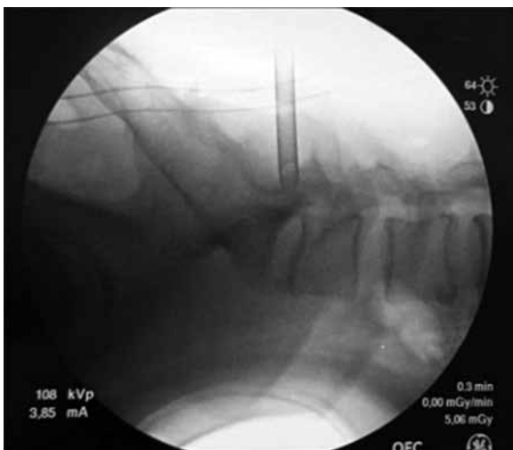
Figura 3 - Confirmação após inserção de canal de trabalho.