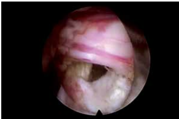
Figura 10 – Ausência de fragmento e visualização da raiz descendente.