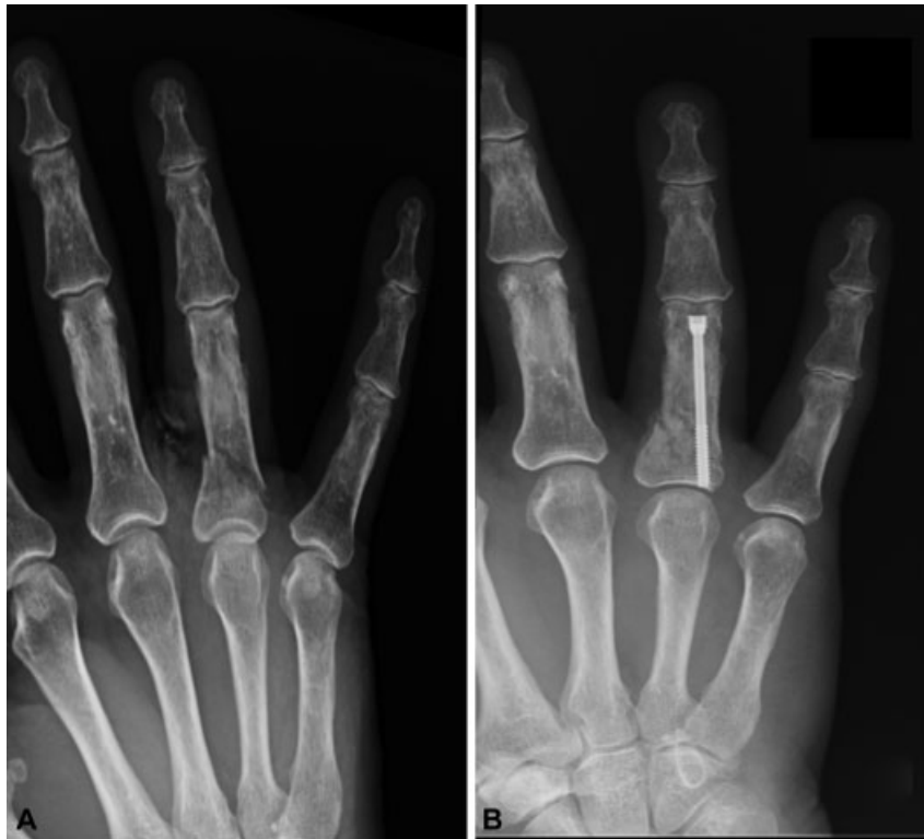
Fig. 6 Paciente de 83 años con fractura de F1 de 4° dedo. Resultado a los 3 meses.