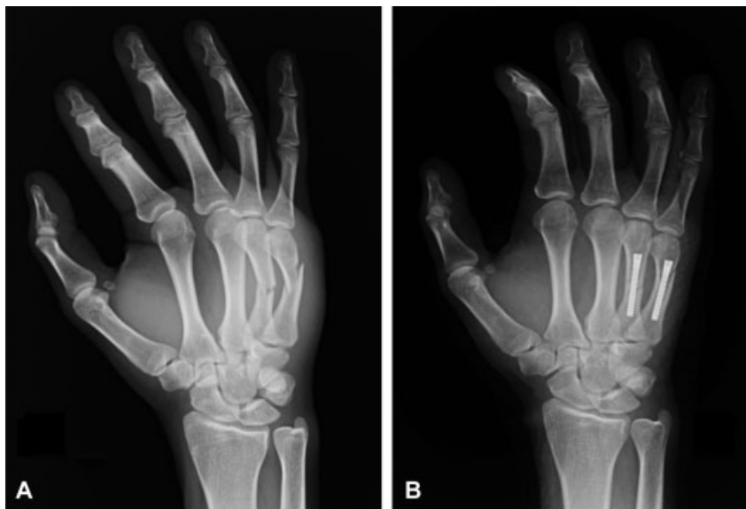
Fig. 4 A. Paciente de 22 años con fractura de 4° y 5° metacarpianos. B. Resultado al año.