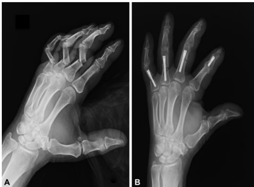
Fig. 8 A. Paciente de 68 años con fractura de F2 de 2° dedo y F1 de 3°, 4° y 5° dedos. Resultado a los 3 meses.