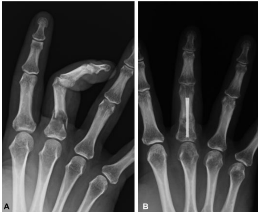
Fig. 7 A. Paciente de 36 años con fractura patológica sobre enchondroma de F1 de 4° dedo. B. Osteosíntesis tras legrado de la lesión e injerto óseo esponjoso a los 2 meses.