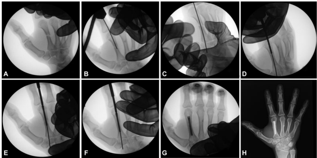
Fig. 2 Técnica de osteosíntesis percutánea con tornillos canulados. A: reducción cerrada. B y C: colocación intramedular de aguja K. D: brocado de canal. E y F: introducción de tornillo intramedular. G: control intraoperatorio. H: resultado a los 2 meses

Con la medida de la anchura de la medular 9 se escoge el tornillo más adecuado, en anchura y en longitud, que permita la fijación de las porciones de la fractura, encastrándose entre las corticales sin producir su abombamiento ni fractura.