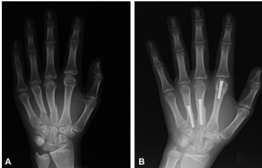
Fig. 5 Paciente de 15 años con fractura de 2°, 3° y 4° metacarpianos. Resultado a los 6 meses.