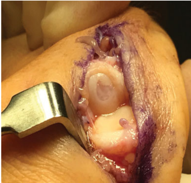
Fig. 9 Defecto condral de superficie articular de 2º metacarpiano en paciente intervenido previamente con osteosíntesis percutánea.