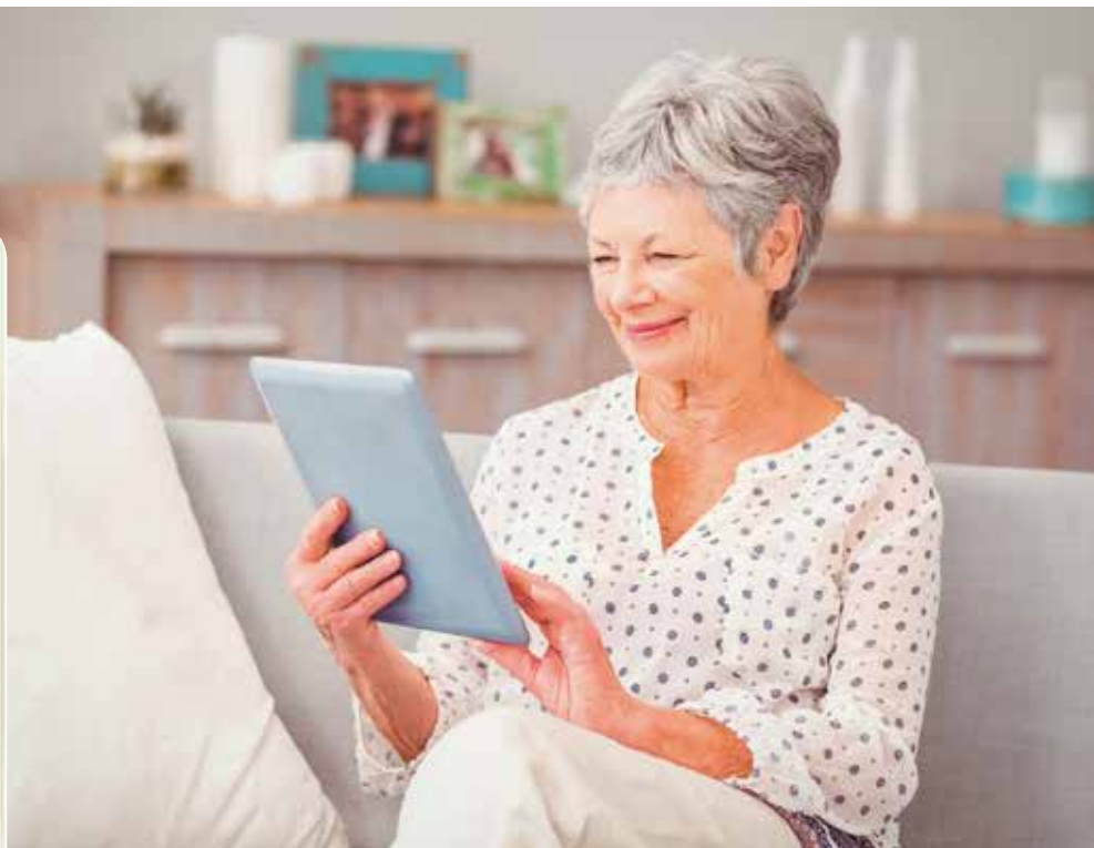
(l.) Vom Patienten eingegebene Antworten ...