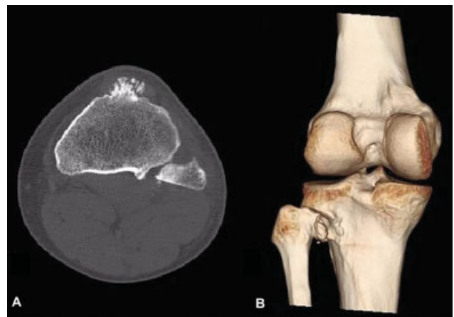
Fig. 2 Tomografia computadorizada em corte axial da articulação tibiofibular proximal (A) evidenciando subluxação tibiofibular proximal anterolateral. Visão posterior de tomografia computadorizada com reconstrução 3D de joelho (B) evidenciando a subluxação anterolateral tibiofibular proximal.

A mobilização ativa e passiva do joelho e do tornozelo foi iniciada imediatamente após o ato cirúrgico. A carga também foi liberada imediatamente com uso de muleta axilar para carga parcial. Iniciaram-se exercícios de fortalecimento isométrico de coxa e perna no mesmo instante. A carga total foi liberada com 1 mês. O paciente voltou às atividades laborais em 2 meses e às atividades esportivas em 3 meses. Após 6 meses de acompanhamento, o paciente possuía flexão de joelho, dorsiflexão e flexão plantar totais e sem limitações (►Fig. 4).