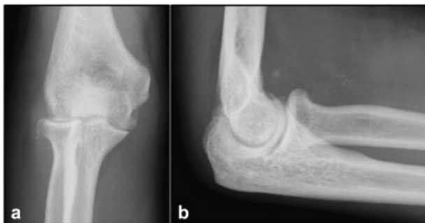
Fig. 1 Radiografias iniciais do cotovelo: visões anteroposterior (a) e lateral (b).

O tratamento inicial foi imobilização de todo o braço com gesso. Como o paciente não sentia mais dor após 7 dias de imobilização, ele parou de usar o gesso e voltou ao trabalho. Dois meses depois, o paciente realizou nova radiografia que mostrou consolidação com pouca deformidade da cabeça radial e baixo grau de osteoartrose (►Fig. 3a, b). No entanto, apenas 6 meses depois, o paciente veio até nós com queixas de dor e limitação de movimento. Durante o exame físico, o paciente apresentou amplitude de movimento reduzida (-80° de extensão e 110° de flexão), mas não apresentou limitação importante na rotação do antebraço. Em seguida,