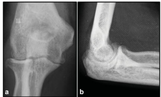
Fig. 3 Radiografias após 2 meses da lesão demonstrando consolidação de fratura com pouca deformidade da cabeça radial e baixo grau de osteoartrose: visões anteroposterior (a) e lateral (b).