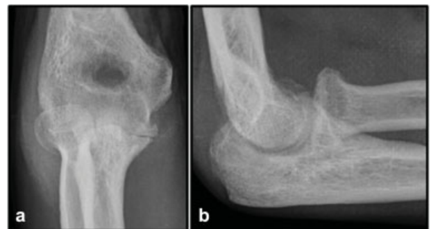
Fig. 4 Visões anteroposterior (a) e lateral (b) do cotovelo 8 meses após a lesão inicial, mostrando osteoartrite global e grave.

o paciente realizou novas radiografias do cotovelo que evidenciavam osteoartrite grave do cotovelo (►Fig. 4a, b). Em seguida, o paciente foi submetido ao desbridamento artroscópico do cotovelo, com importante melhora na amplitude de movimento e dor.