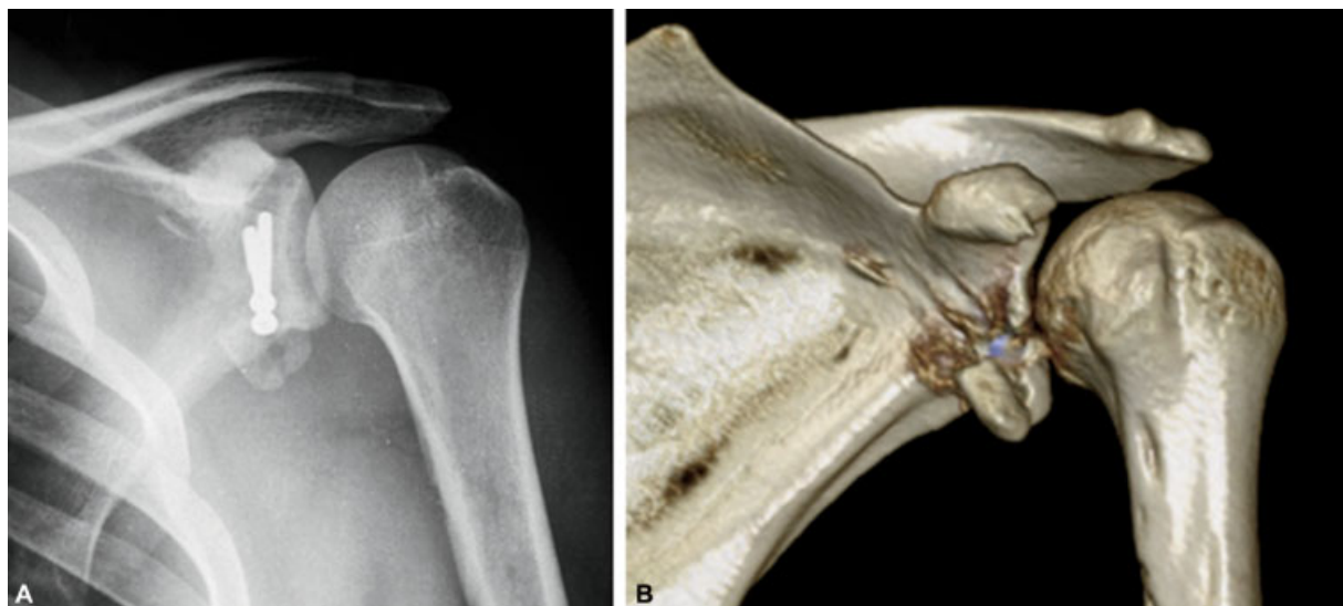
Fig. 2 Radiografia (A) e TC 3D (B), após 3 semanas, evidenciando fratura do enxerto.