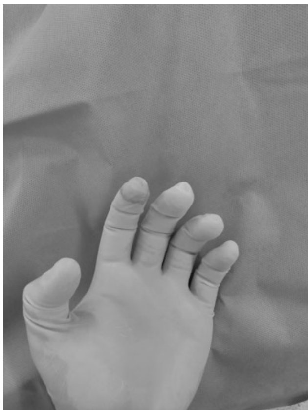
Fig. 1 luva interna mostrando perda da integridade do indicador esquerdo percebido ao final da cirurgia.

cirurgias de foco aberto (redução direta e manipulação dos fragmentos ósseos, como antebraço ou fraturas articulares)