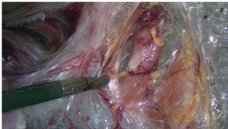
Abb. 1 Pelvine LNE iliaca extern rechts, im Bereich der Fassung ist das Lig. umbilicale laterale sichtbar.

Tumore, die auf die endometriale Schleimhaut begrenzt sind oder das Myometrium weniger als 50% der gesamten Myometriumdicke infiltrieren (pT1a), haben bei einem zusätzlich vorliegenden hohen Differenzierungsgrad (G1) ein sehr geringes Risiko der pelvinen und paraaortalen LN-Metastasierung. Deswegen soll bei endometrioiden Karzinomen im Stadium pT1a und G1 oder G2 bei makroskopisch unauffälligen Lymphknoten keine LNE durchgeführt werden [15].