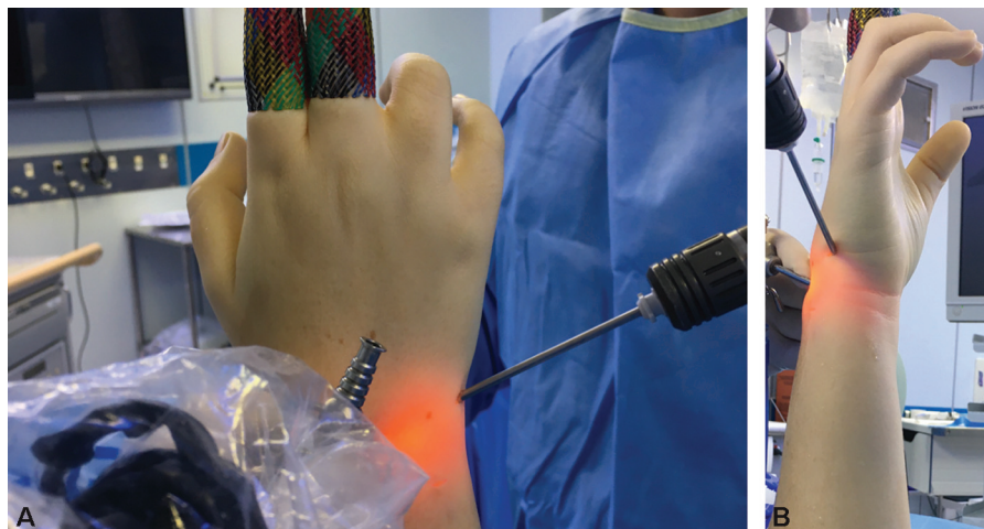
Fig. 1 (A) Vista dorsal do punho após a criação do portal piramidal-hamato (PH), que é criado distalmente ao portal 6U. (B) Vista ulnar do punho após a colocação do portal PH, criado distalmente ao portal 6U.

Em nosso único caso em que esse truque foi realizado, após o desbridamento de todas as superfícies condrais, como na técnica padrão descrita anteriormente, o portal PH foi criado para a obtenção de um excelente acesso às superfícies condrais anteriores do hamato e do capitato. Isso permitiu a ressecção de toda a cartilagem até o osso subcondral, aumentando consideravelmente a superfície de contato entre o semilunar e a cabeça do capitato, e entre a parte distal do piramidal e a superfície proximal do hamato (► Figs. 1A, 1B, 2A, 2B, 2C e 2D ). As etapas cirúrgicas seguintes foram semelhantes àsquelas em uma abordagem padrão para uma fusão de quatro cantos. 3,4