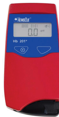
Fig. 1 Dispositivo de testagem rápida de hemoglobina.

No momento do encaminhamento para artroplastia total primária do quadril (ATQ), todos os pacientes são submetidos a uma medição rápida dos níveis de hemoglobina na clínica ortopédica, por meio do analisador de hemoglobina (HemoCue®, ver ►Fig. 1). Este dispositivo fornece uma leitura instantânea, portanto, uma rápida identificação do quadro de anemia. Um resultado baixo leva a uma investigação mais aprofundada, caso o paciente apresente índices de Hb inferiores (<130 g/L homens ou <115 g/L mulheres), neste caso deve ser realizado um hemograma completo em laboratório. O paciente também inicia a terapia com ferro por via oral,