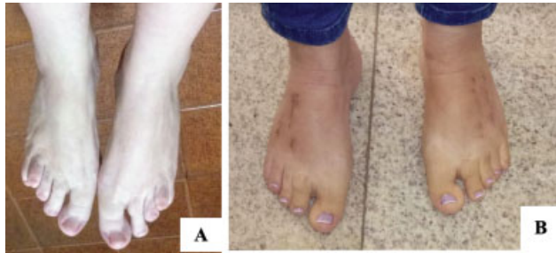
Fig. 5 Aspecto clínico pré-operatório (A) e pós-operatório (B) de paciente com braquimetatarsia bilateral em 3° e 4° metatarsos submetidos a distração osteogênica com uso de fixador monolateral.

A distração osteogênica tem como desvantagem a necessidade do ajuste regular do fixador externo para alongamento, a possibilidade de formação óssea insuficiente e o risco de infecção local. Para estímulo da formação óssea adequada, uma osteotomia cuidadosa deve ser realizada com o mínimo de dano ao tecido mole e vascular. 11,18