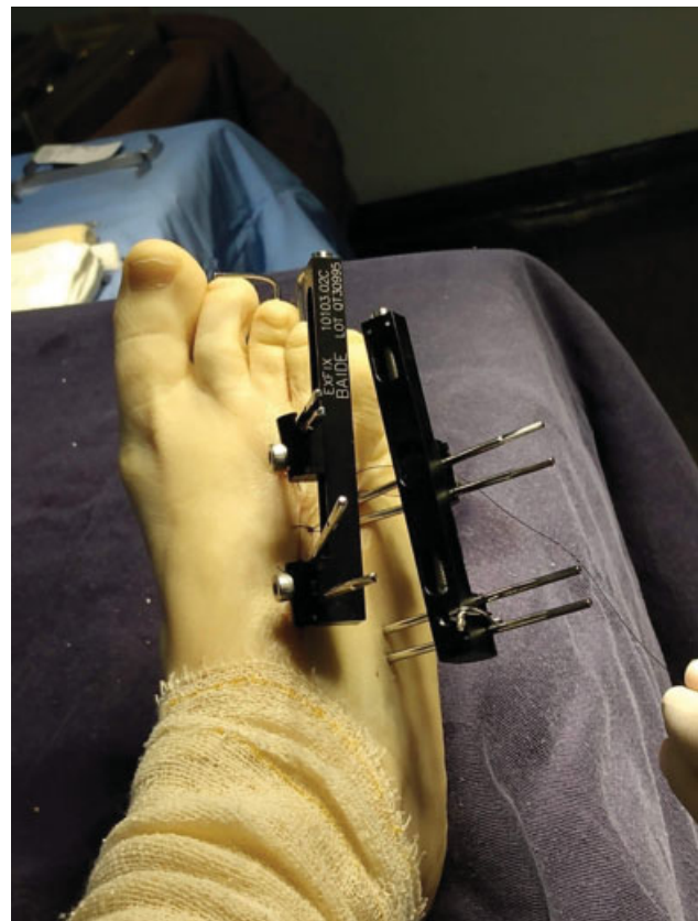
Fig. 2 Fixador externo monolateral instalado para distração óssea em inclinação de 45° e fios de Kirschner intramedulares.

osteótomos delicados sob visualização direta e é feita a conferência da mesma por fluoroscopia no intraoperatório. Em seguida, realiza-se a fixação da articulação metatarso-falângica com um fio de Kirschner 1.5 (► Figura 2 ), para se evitar deformidade em flexão da falange durante o alongamento por distração. Depois, faz-se o fechamento da incisão de pele no local da corticotomia com fio de nylon 4.0 e curativos em pinos. Quando há a necessidade de colocação de mais de um fixador externo, o procedimento é realizado da mesma maneira, tomando-se o cuidado na distância entre as montagens para não dificultar a distração e o alongamento.