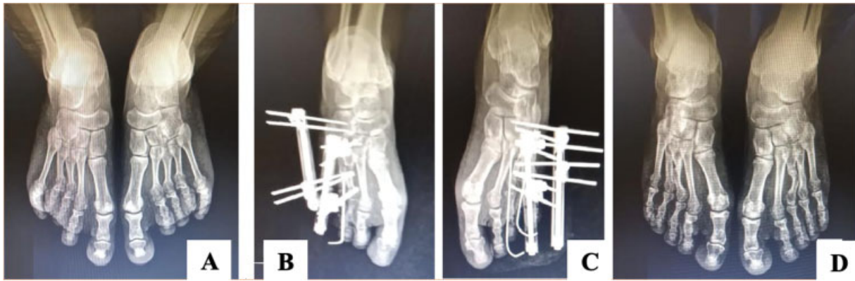
Fig. 1 Radiografia em anteroposterior dos pés com carga demonstrando evolução de paciente com braquimetatarsia bilateral em 3º e 4º metatarsos submetido a distração osteogênica. (A) radiografia pré-operatória, (B) radiografia pós-operatória do lado direito, (C) radiografia pós-operatória do lado esquerdo e (D) resultado após 12 semanas de tratamento.

Statistics for Windows versão 17.0 (SPSS Inc., Chicago, IL, EUA). O estudo incluiu 6 pacientes com diagnóstico de braquimetatarsia tratadas entre janeiro de 2018 e abril de 2020 e um total de 8 pés e 13 metatarsos.