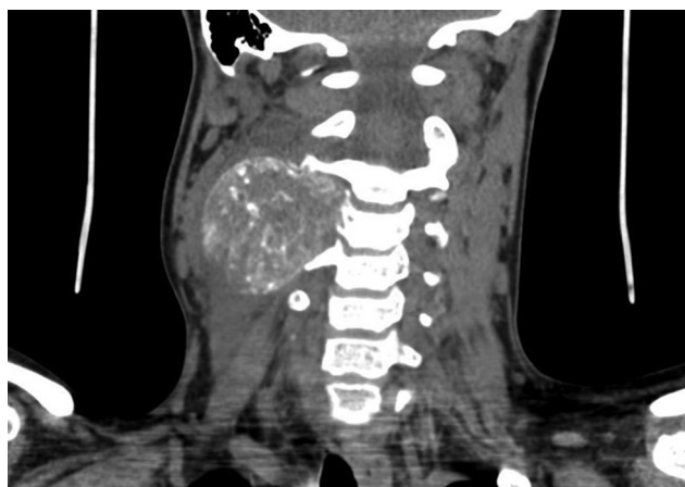
Fig. 1 Tomografia computadorizada com envolvimento de C3 no diagnóstico.

Os osteblastomas são geralmente histologicamente indistinguíveis dos osteomas osteoides, sendo estes raramente maiores que 1,5 cm. As taxas de incidência na coluna vertebral são de 40%, geralmente comprometendo os pedículos e a lâmina. Por outro lado, o OA é associado mais frequentemente com a extensão paravertebral e peridural.