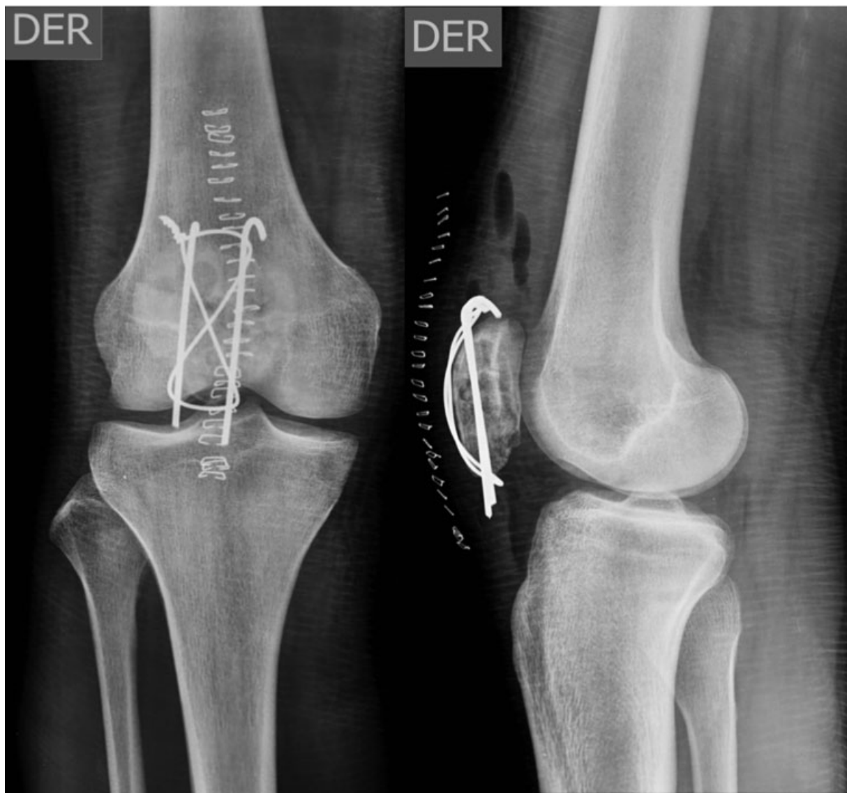
Fig. 1 Radiografías en proyecciones anteroposterior (AP) y lateral, en que se observa fractura de patela tratada mediante el uso de banda de tensión con agujas de Kirchner y asa de alambre.

mayor estabilidad que la configuración clásica, 5 manteniendo el principio teórico de convertir las fuerzas de tensión anterior de la patela generadas por el cuádriceps en compresión a nivel de la superficie articular. 1-3,5