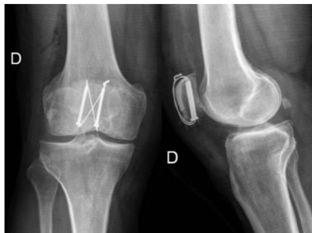
Fig. 2 Radiografías en proyecciones AP y lateral, en que se observa fractura de patela tratada mediante el uso de banda de tensión realizada con asa de alambre por medio de tornillos canulados.

Es fundamental considerar la biomecánica del hueso y el método de fijación a utilizar; en el caso de la patela, el ángulo entre el vector de fuerza del cuádriceps y el del tendón patelar determina que, en flexión, la patela se doble separando los fragmentos, 1 lo que es neutralizado por la banda de tensión, que convierte dichas fuerzas en