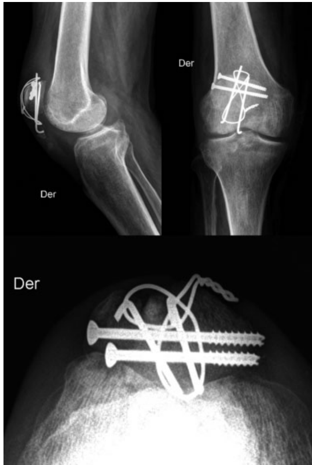
Fig. 3 Imágenes de radiografía de rodilla derecha con fractura de patela tratada mediante banda de tensión con agujas de Kirchner y tornillos canulados. Es visible la protrusión de elementos de osteosíntesis, lo que se correlaciona con la sintomatología referida por el paciente.

compresivas a nivel de la fractura, siendo la variante realizada por medio de tornillos canulados la más estable. 15