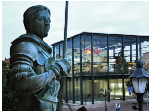
Bückeburg, Ort für die 54. Jahrestagung der DGLRM.

spannende Plenar- und Weiterbildungsvorträge sowie eine Fachbesichtigung und ein unterhaltsames wie auch lehrreiches Rahmenprogramm beinhalten.