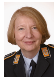
Ich freue mich auf viele interessante Beiträge und grüße Sie, wie immer, aus Fürstenfeldbruck

Bitte reichen Sie Ihre Abstracts für Vorträge und Posterpräsentationen bis zum 31. März 2016 ein! Das Abstractformular finden Sie auf der Homepage. Wie es bei uns bereits langjährige Tradition ist, werden die besten Poster wieder mit Preisen gewürdigt. Weitere Details entnehmen Sie bitte unserer Homepage www.dglrm.de .