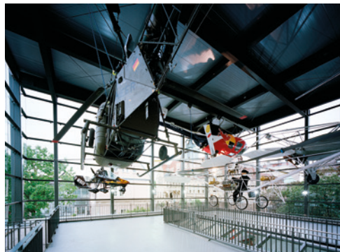
Blick auf ein Exponat des Museums.

Zur aktiven Mitwirkung bei der Programmgestaltung möchten wir Sie, wie jedes Jahr, zur Einreichung von Beiträgen auffordern und Ihnen damit Gelegenheit geben, der Fachwelt Ihre neu gewonnenen Ergebnisse und Erkenntnisse in Vorträgen und Postern zu präsentieren und zur Diskussion zu stellen. Wir freuen uns auf Ihre aktive Teilnahme, lebhaft wissenschaftliche Diskussionen, einen angeregten persönlichen Austausch sowie spannende Tage in der reizvollen Stadt Bückeburg!