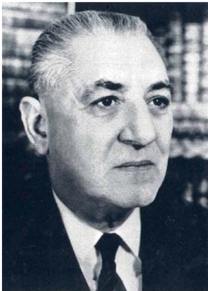
Abb. 5 Prof. Carrié.

tungen ergänzt. Weiterhin entstand durch die Umbauten Platz für moderne Diagnostik-, Therapie- und Funktions- sowie Laborräume. Die Hautklinik erhielt einen vergrößerten Ambulanztrakt mit Laboratorien für die Hautphysiologie und Allergologie, eine Bibliothek wurde eingerichtet und ein Archiv sowie Sozialräume für das Personal geschaffen. Moderne Operationsräume mit Klimaanlage und dazugehörigen Funktionsräumen, die zur Steigerung der OP-Zahlen führten, wurden in der 1. Etage der Klinik etabliert.