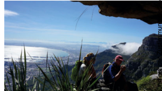
Wanderung auf dem Tafelberg mit Blick auf Kapstadt.