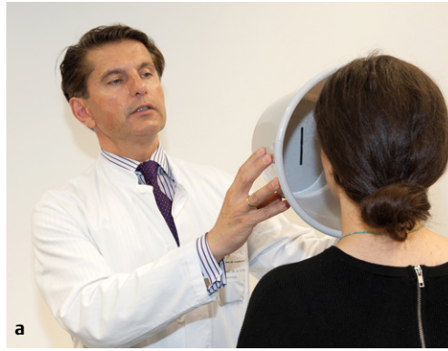
Abb. 2 Bestimmung der subjektiven visuellen Vertikalen (SVV) mit dem „Vertikalentest mit SVV-Eimer“ [9]. (a) Der Patient schaut in den Eimer auf eine an der Unterseite angebrachte Linie, die er senkrecht einstellen muss. (b) Der Untersucher liest dann die Ablenkung von der tatsächlichen Vertikalen („Lot“) ab. Es sollten 10 Einzelmessungen stattfinden. Der Referenzbereich ( \bar{x} \pm 2 SD) liegt bei 0 \pm 2,5^\circ .