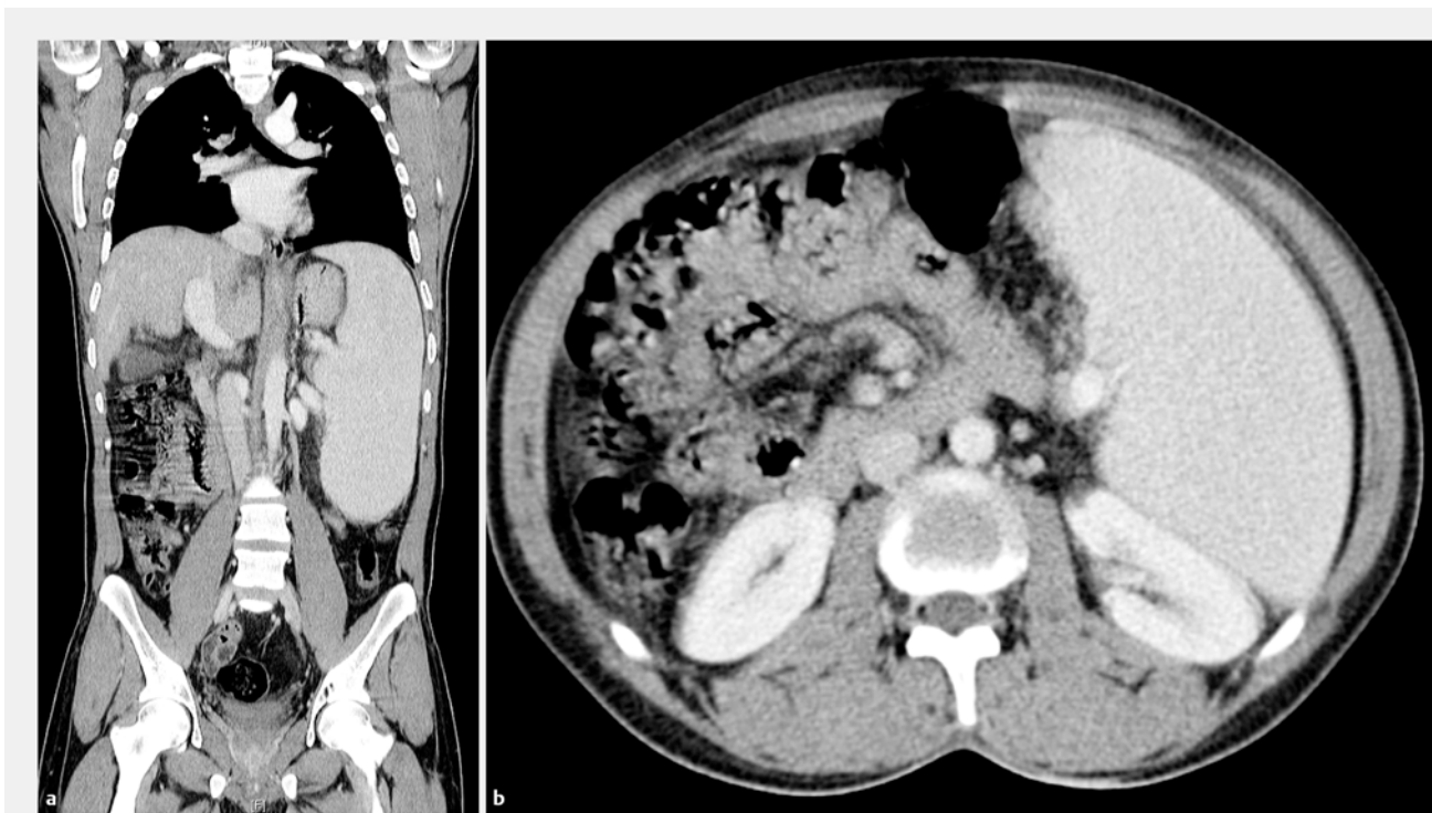
► Abb. 2 Computertomografie des Thorax und Abdomens mit ausgeprägter Splenomegalie sowie kaliberstarker Pfortader und V. lienalis als Ausdruck der portalen Hypertension.

In diesem Zusammenhang muss auch die konsekutive Thrombozytopenie gewertet werden, welche die initialen Hämoptysen bedingte. Weitere Blutungen waren nicht aufgetreten. Sollte eine signifikante Thrombozytopenie auch im weiteren Verlauf fortbestehen, wird eine Splenektomie diskutiert werden [2], die bis dato noch nicht erfolgt ist. Eine weitere gefürchtete Komplikation der Schistosomiasis ist die Entwicklung einer pulmonalen Hypertonie aufgrund der Embolisierung der Schistosoma mansoni -Eier in die Lungenstrombahn mit lokaler Inflammation und Granulombildung [3]. In dem vorgestellten Fall ergab die Echokardiografie keinen Hinweis auf eine pulmonale Hypertonie.