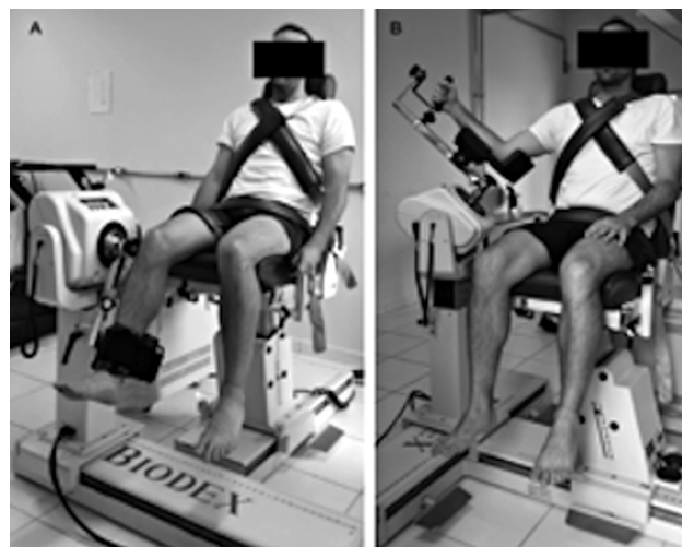
Fig. 1 Avaliação isocinética de joelho e ombro.

No 3° dia, os atletas sentaram-se na cadeira isocinética e o examinador posicionou o ombro dominante a 60° de abdução e 30° de adução horizontal (plano escapular), com o cotovelo em 90° de flexão 19 (►Fig. 1b). Cintas estabilizadoras foram fixadas na pelve e no tronco. A ADM do ombro foi limitada em 90°, começando com 50° de rotação interna (RI) e terminando em 40° de rotação externa (RE), considerando 0° como o antebraço em posição horizontal. A razão entre rotadores internos e rotadores externos foi determinada em 60°/s e 360°/s, e o índice de fadiga em 360°/s. 19 Seis atletas não compareceram à avaliação isocinética do ombro realizada no 2° dia (por motivos pessoais). Portanto, 43 atletas (média \pm DP de idade, 21,30 \pm 4,19; estatura, 1,96 \pm 0,06; e massa corporal, 89,98 \pm 8,83) foram submetidos ao teste isocinético de ombro.