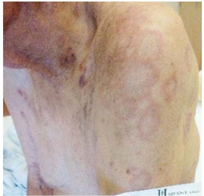
► Abb. 1 Hautbefund vom linken Oberarm und Brust.

Wir berichten über den Fall eines 82-jährigen Patienten, der seit mehr als 2 Jahren über progredient zunehmende, randbetonte Hautveränderungen klagt, die von stärkerem Juckreiz begleitet sind. Im Verlauf entwickelte der Patient am Nackenbereich noch zusätzlich eine dunkle, derbe Plaque. Fast zum gleichen Zeitpunkt vor mehr als 2 Jahren wurde ein Urothelkarzinom des Ureters pT2, cM0, G3, R0 rechts bei dem Patienten diagnostiziert. Es erfolgte eine Nephroureterektomie rechts und regelmäßige ambulante onkologische Kontrolluntersuchungen ohne begleitende medikamentöse Therapie. Vor ca. 2 Monaten erfolgte die erneute urologische Vorstellung des Patienten bei V. a. Tumorrezidiv im Bereich der Harnblase. Darauf folgend erfolgte die TUTUR-Nachresektion mit dem Ergebnis eines Rezidivurothelkarzinoms der Harnblase pT1 G2. Aktuell gilt der Patient als tumorfrei. Der Patient gibt an, in der Zeit zwischen den beiden Eingriffen vorübergehend etwas weniger Juckreiz und weniger ausgeprägte Hautveränderungen gehabt zu ha-