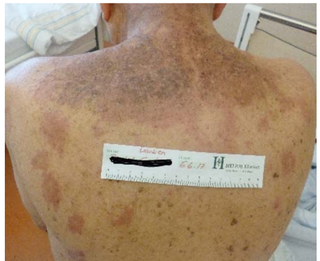
► Abb. 2 Hautbefund vom Rücken.

ben. Die bisherige langjährige ambulante Behandlung mit verschiedenen topischen Glukokortikoiden blieb ohne wesentlichen Erfolg.