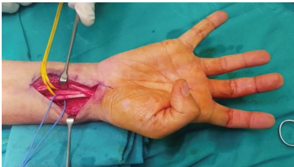
Fig. 3 Imagen intraoperatoria tras la escisión del tejido anómalo, mostrando el movimiento independiente de ambos tendones mediante WALANT.