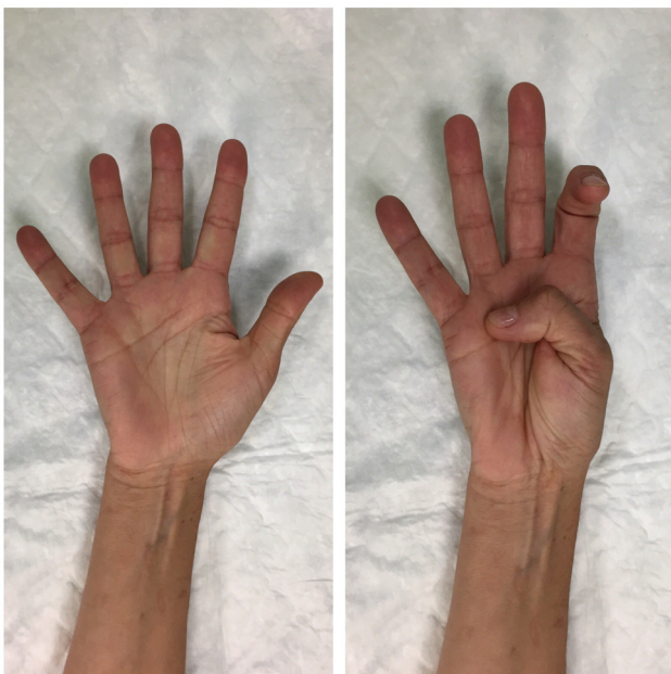
Fig. 1 Imagen preoperatoria mostrando la flexión involuntaria de la articulación IFD del índice, al realizar flexión activa de la IF del pulgar.

Debido a esta clínica, se le indicó baja laboral, y, posteriormente, fue reubicada, por su incapacidad para empuñar el arma reglamentaria, sin que la disparase involuntariamente.