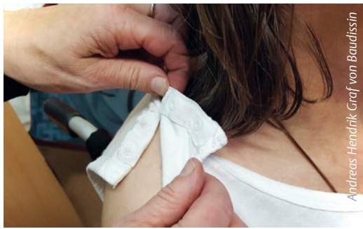
Abb. 1 Das Hemdchen mit Druckknöpfen lässt sich an den Schultern rechts und links öffnen. Es kann angezogen werden, ohne die Arme zu heben oder zu senken.