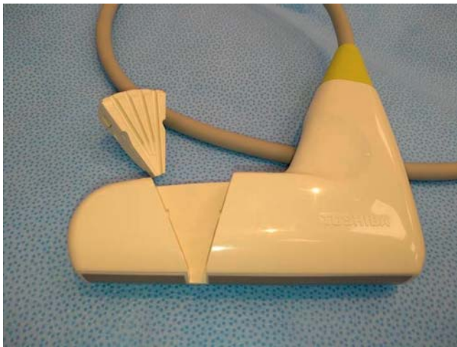
► Abb. 7 Punktionschallkopf mit herausgenommener Nadelführung: Diese Schallköpfe und Nadelführungen sind grundsätzlich zu sterilisieren, da die Nadel im Kanal beide Teile berührt.

Im angelsächsischen und französischen Sprachraum findet man oft eine Unterscheidung in „low-“, „intermediate-“ und „high-level disinfection“. „Low-level disinfection“ meint dabei die Abtötung der meisten vegetativen Bakterien, einiger Pilze und Viren in kurzer Zeit (< 10 min). „High-level disinfection“ bedeutet, dass alle Mikroorganismen inkl. Sporen abgetötet werden [32, 37]. Diese Einteilung hat in Deutschland keine rechtliche Relevanz.