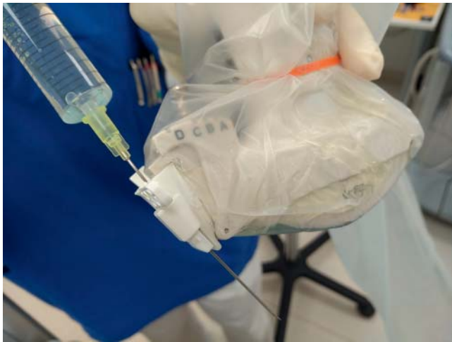
► Abb. 6 Schallkopf mit Punktionsadapter: Der Führungsadapter ist unter dem sterilen Überzug am Schallkopf befestigt, die sterile Einweg-Nadelführung wird darüber angeklemt. Der Schallkopfüberzug deckt auch das Schallkopfkabel ab.