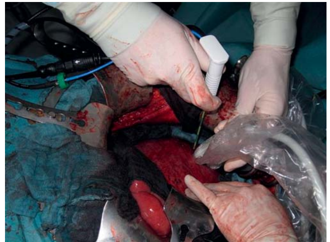
► Abb. 8 Intraoperative Sonografie mit Intervention: Der sterilisierte oder einer bakteriziden (einschließlich Mykobakterien), fungiziden und viruziden Tauchdesinfektion unterzogene Schallkopf ist steril verpackt, der Untersucher ist wie die Operateure eingekleidet.