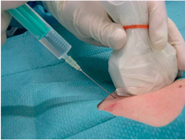
► Abb. 3 Korrekte Anwendung des sterilen Schallkopfüberzuges bei der Freihand-Biopsie mit möglichem Kontakt zwischen Nadel und Schallkopf. Der Untersucher trägt sterile Handschuhe. Ein Abdeck-/ Lochtuch als Barrieremaßnahme ist dann obligat, wenn Material (z. B. Spritze) während der Punktion gewechselt/ abgelegt werden muss.