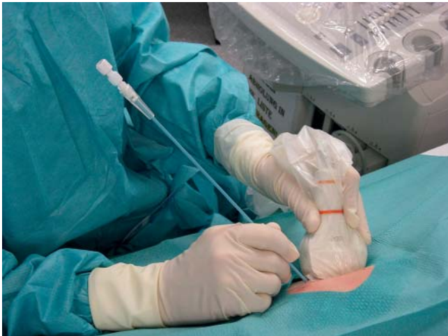
► Abb. 4 Anlage einer Abszessdrainage: Schallkopf, Kabel und Tastatur sind mit sterilen Abdeckungen überzogen, der Untersucher ist nach Händedesinfektion analog der OP-Situation eingekleidet. Ein Abdeck-/ Lochtuch dient als Barrieremaßnahme. Als Kontaktmedium dient steriles Ultraschallgel. Zusätzlich wird ein steriler Arbeitstisch bereitgehalten.

Kommen Schallsonden mit Schleimhaut oder krankhaft veränderter Haut in Berührung, z. B. im Rahmen der Introitus- oder Perinealsonografie, sind sie sogenannte „semikritische Medizinprodukte ohne besondere Anforderungen an die Aufbereitung“. Bei diesen muss die Desinfektion nachgewiesen bakterizid (einschließlich Mykobakterien), fungizid und viruzid wirksam sein. Zu beachten ist, dass die Viruzidie-Prüfung entsprechend der jeweils aktuellen Leitlinie der Deutschen Vereinigung zur Bekämpfung der Viruskrankheiten und des Robert-Koch-Instituts erfolgt sein muss [14].