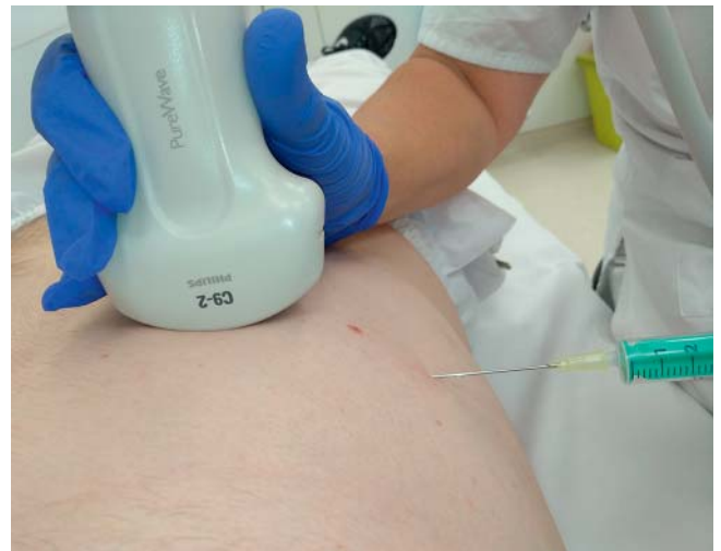
► Abb. 2 Ein Sicherheitsabstand zwischen Schallkopf und steriler Nadel wird bei dieser Freihand-Biopsie eingehalten. Kann der Untersucher gewährleisten, dass die Nadel den Schallkopf nicht berührt, kann auf einen sterilen Schallkopfüberzug verzichtet werden.

keit und Unversehrtheit des Schallkopfes. 2012 veröffentlichten die KRINKO und das BfArM „Anforderungen an die Hygiene bei der Aufbereitung von Medizinprodukten“ [14].