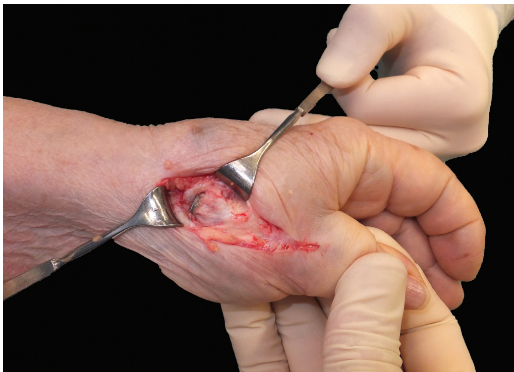
Fig. 7 El stress shielding deja expuesta la base metálica del vástag, que puede provocar conflicto con el escafoides o trapecoide.

número reducido de casos, aunque el seguimiento es lo suficientemente largo. Sin embargo, al comparar con el estudio de Kaszap et al., 6 en el cual la puntuación media de Quick DASH para la trapeciectomía secundaria fue de 16 (SD 4.3), en nuestra serie los resultados difieren en más de 30 puntos, con una media de 48.6 (IC del 95% 34.9-62.2), un valor muy elevado teniendo en cuenta que el rango es de 0 a 100, siendo 0 el mejor valor posible.