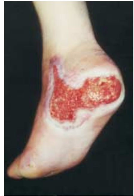
Abb. 3 Ulkus mit roter sauberer Granulation und beginnender Epithelisierung vom Randbereich.

Putrescine und Kadaverine. Durch Silberimprägnierung kann die antimikrobielle Wirkung noch gesteigert werden [19].