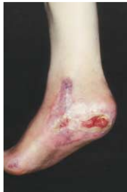
Abb. 4 Nahezu abgeheiltes Ulkus mit guter Epithelisierungstendenz.

Hydrogele sind dreidimensionale Netzwerke aus hydrophilen Polymeren, die einen unterschiedlichen Prozentsatz an Wasser beinhalten, selbst aber unlöslich sind. Durch Ausdehnung der Querverbindungen der Polymerketten können Flüssigkeit und darin enthaltene Makromoleküle aufgenommen werden. Die wundferne semipermeable Polyurethanfolie sorgt für die Aufrechterhaltung eines feuchten Wundmilieus und dient als Barriere zur Außenwelt [14]. Die semitransparenten Eigenschaften ermöglichen auch bei mehrtägiger Tragedauer eine Wundin-