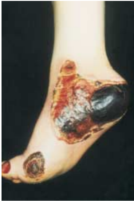
Abb. 1 Ulkus mit großflächiger Nekrose.