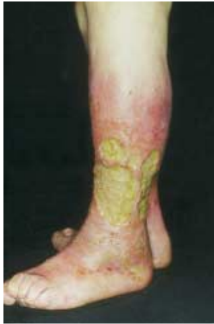
Abb. 2 Ulkus mit schmierig-gelblichem Belag.