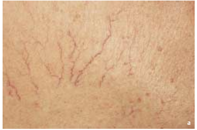
Abb. 3 Patientin 2: Rote Besenreiser am Oberschenkel (konstitutionell). a vor Therapie, b nach 5 Monaten, 3 Dioden-Laserbehandlungen.