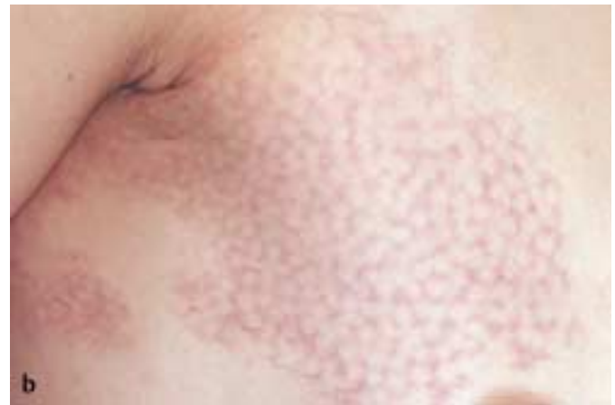
Abb. 3 b Z. n. einer Sitzung durch gepulsten Farbstofflaser.