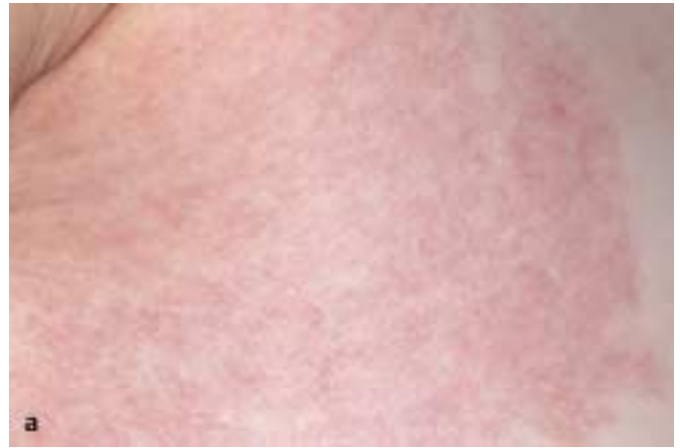
Abb. 3 a Nävus flammeus.

Teleangiektasien werden ihrer Entstehungsursache nach in primäre und sekundäre eingeteilt. Zu den primären Teleangiektasien zählen der Naevus teleangiectaticus, das Bloom-Syndrom