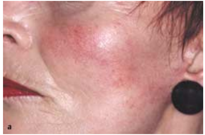
Abb. 4 a Teleangiektasien

Tief liegende benigne venöse Gefäßveränderungen können prinzipiell chirurgisch, durch Sklerosierung und den Nd:YAG-Laser (perkutan/interstitiell) behandelt werden. Die Nebenwirkungen