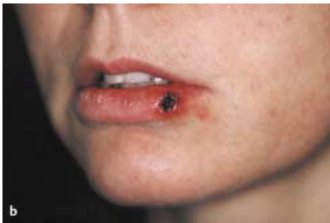
Abb. 5 b Zustand direkt nach dem Lasereingriff.