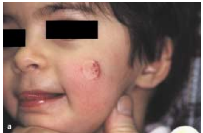
Abb. 2 a Verbliebene Hämangiomreste nach Kontaktkryotherapie.

Der gepulste Farbstofflaser ist mit der Kontaktkryotherapie die Therapiemethode der Wahl [4,11,20,27,31] (Abb. 2 a u. b). Mit dem gepulsten Farbstofflaser wird in über 90% der Fälle in 1–4 Sitzungen im Abstand von 2–4 Wochen ein Wachstumsstopp erzielt, Hohenleutner et al. berichten sogar über eine Erfolgsquote von 97% [27]. Eine vollständige Aufhellung wird dabei in ca. 40%, eine über 75%ige Clearancerate in etwa 70% der Hämangiome erzielt. Die besten Ergebnisse werden bei einer Dicke von \leq 3 mm erreicht. Das Risiko für bleibende Nebenwirkungen ist niedrig ( < 1\% ).