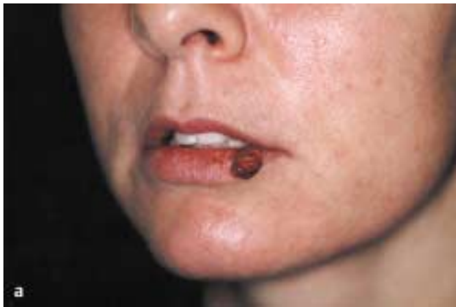
Abb. 5 a Granuloma pyogenicum.