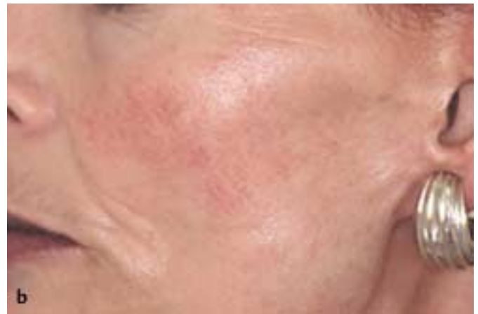
Abb. 4 b Z. n. 3 Behandlungen durch langgepulsten KTP-Nd:YAG-Laser.

ebenso wie die Flächenausdehnung, die Lokalisation, die Gefäßgröße und -tiefe, welche zuvor mittels farbkodierter Duplexsonographie bestimmt werden sollten, limitieren allerdings o.g. Vorgehensweisen. Am besten bewährt hat sich für diese Indikation die IPL-Technologie [25,39,43]. Der Einsatz des gepulsten Farbstoff- und langgepulsten KTP-Nd:YAG-Lasers sowie die Kryotherapie sind aufgrund der geringen Eindringtiefe ineffektiv.