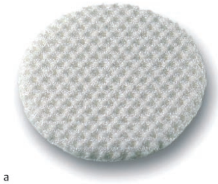
Abb. 2 Strukturier-tes Composite-Wundpad auf Grund-lage der Sticktech-nologie: a TISSUPOR®.