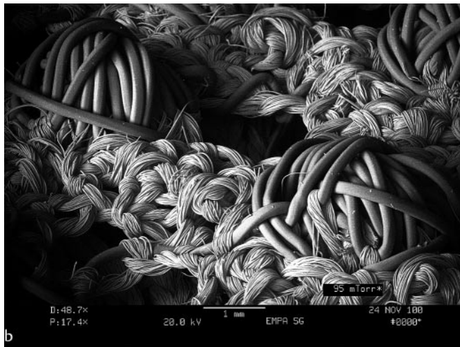
b Scanning-Elektronenmikroskopie der strukturierten, verschieden-porigen Oberfläche zur Stimulation der Neoangiogenese.