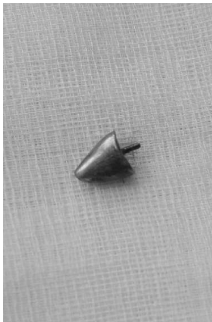
Abb. 5 Extrahiertes Implantat.

render Faktor für eine Aspiration gilt insbesondere die flache Lagerung des Patienten während der Behandlung.