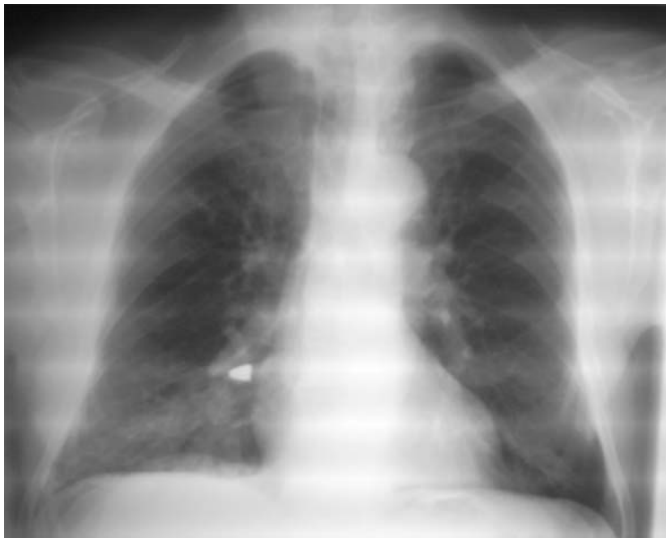
Abb. 1 Röntgenübersicht Thorax pa. Metallischer Fremdkörper im Unterlappenbronchus rechts mit begleitender Verschattung des Unterfeldes rechts.