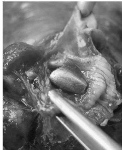
Abb. 4 Operationspräparat. Stiftkrone nach der Eröffnung des Unterlappenbronchus.

„in den nächsten Tagen“ auf die Ausscheidung des Zahns mit dem Stuhlgang zu achten. Das Implantat fand sich jedoch nicht im Stuhlgang. Nachdem der Patient keine Beschwerden, insbesondere keine abdominellen Schmerzen und keinen Hustenreiz oder Dyspnoe angab, wurden von Seiten des Zahnarztes keine weiteren Maßnahmen veranlasst. Der Hausarzt wies den Patienten nun nach Anfertigung der Röntgenaufnahme unverzüglich in die pneumologisch-thoraxchirurgische Fachklinik ein.