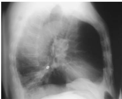
Abb. 2 Röntgenübersicht des Thorax seitlich.