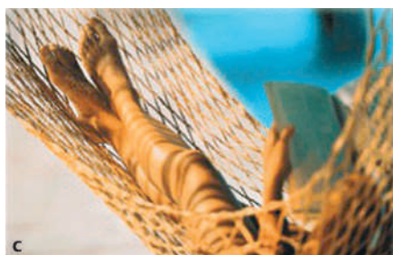
Abb. 1 a „Vornehme Blässe“ Anfang des letzten Jahrhunderts. b Bräunung durch tägliche Arbeit an der freien Luft. c „Gesunde“ Urlaubsbräune.

se kommen vielfach ohne medizinische Überwachung und Kontrolle, auch bezüglich der Inhaltsstoffe, zur Anwendung. Somit ergeben sich zusätzliche Risiken und Gefahren, die in manchen Fällen sogar eine Konsultation beim Hautarzt notwendig machen.