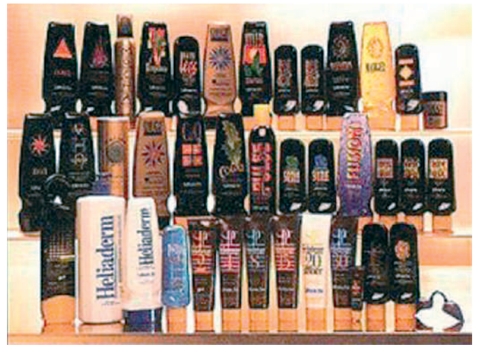
Abb. 3 Vielfalt von Bräunungsbeschleunigern.

Nachteilig an DHA ist der häufig unnatürliche gelbe Farbton, die scheckige Pigmentierung sowie ein Versagen bei jedem 10. Anwender. Hier wird fraglich eine andere Hornschichtzusammensetzung verantwortlich gemacht. Des Weiteren verbreitet das DHA ein sehr charakteristisches Aroma, das selbst durch Parfum-