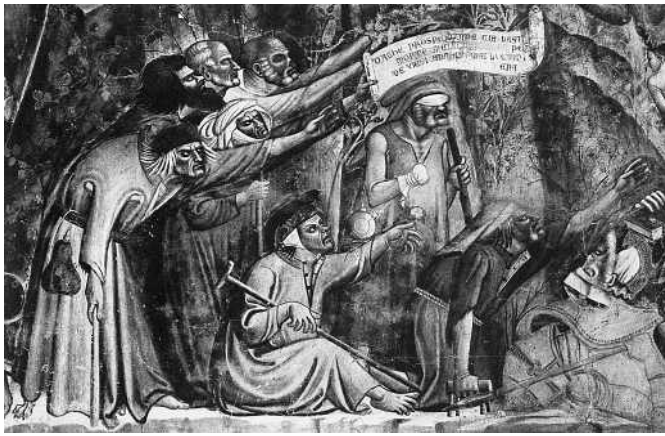
Abb. 3 Meiss, Millard. An Illuminated Inferno and Trecent Painting in Pisa, in: Art Bulletin 47, 1965, S. 31

das Christentum zur Staatsreligion erklärt hatte, Bischof von Rom. Die „Konstantinische Schenkung“ ist mit seinem Namen verknüpft. Einer späten Legende nach soll er Kaiser Konstantin vom Aussatz geheilt haben – „Aussätzige“ erfluchten deshalb Hilfe von ihm.