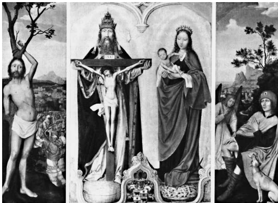
Abb. 6 Quinten Massys (1465/66 – 1530), Flügelaltar. Alte Pinakothek München, Erläuterungen zu den ausgestellten Werken, München 1983, S. 311.

für ein Patronat prädestiniert. Der Legende nach unternahm er eine Pilgerfahrt nach Rom. Unterwegs half er Pestkranken und wurde auf der Rückreise selbst krank. Da er wegen seiner Armut keine Unterkunft fand, zog er sich in die Einsamkeit zurück, nur ein Hund brachte ihm Brot. Durch ein Wunder wurde er geheilt. Auf Gemälden wird er oft mit einem Pestausschlag dargestellt. Seuchen, Cholera und natürlich Pest fallen unter sein Patronat. Wiederholt wird er zusammen mit Sebastian dargestellt (Abb. 6).