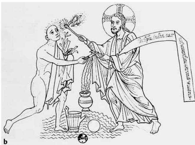
Abb. 2 a und b Rosalie Green (Hrsg), Herrad of Hohenbourg, Hortus Deliciarum, London Warburg Institute 1979, Bd. 2, S. 403.

Peststerben bei ihnen beginnt. 4 Sebastian wurde bereits in der „Depositio martyrum“, einem „Heiligenkalender“ des Jahres 354, genannt. Die in Rom und Pavia 680 ausgebrochene Pest („ein großes Sterben“) erlosch erst, nachdem „einem guten Menschen von Gott kund getan“ worden war, dass die Reliquien des heiligen Sebastian von Rom nach Pavia zu überführen seien und ihm dort eine Kirche gewidmet werden sollte.