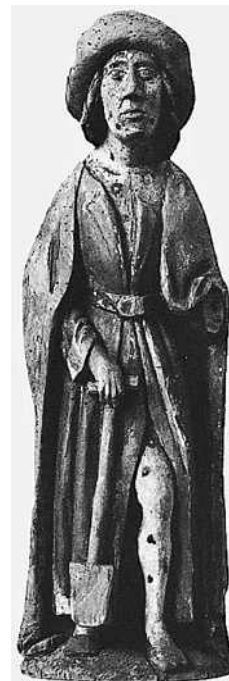
Abb. 5 Holzskulptur des heiligen Fiakrius (Württembergisches Landesmuseum), John L. Flood, S. 199.

Hautkranke. Sebastian Brant empfahl ihn in seinem „Heiligenleben“: den, „der in eret jnniclich“, er „wöl behüten vor der schweren krankheit der blatern und wartzen, die leider zu dieser Zeit fast regierent“ 6 (Abb. 5). Genauso wie er im 16. Jahrhundert um Hilfe bei der um sich greifenden neuen Krankheit Syphilis angerufen wurde, so sollen sich nun die von AIDS Betroffenen an ihn wenden.