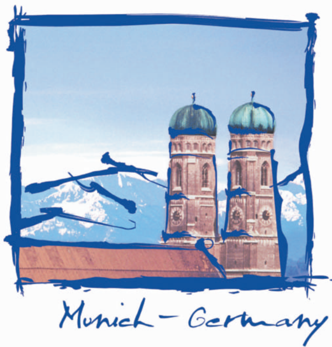
Abb. 2 Der nächste Jahreskongress findet vom 2.–6. Sept. 2006 in München statt. Die Abstract-Deadline ist der 23. Februar 2006. Abstracts können nur online über die ERS-Webseite ( www.ersnet.org ) eingereicht werden.

Die ERS wächst stetig. Gegenwärtig hat die ERS 7500 Mitglieder, wobei alleine beim Kongress in Kopenhagen über 700 neue Mitglieder gewonnen wurden. Der Kongress in Glasgow wurde von 15 000, der von Kopenhagen von ca. 16 000 Teilnehmern besucht. Dadurch kann die ERS auch öffentlichwirksam Projekte initiieren und auf europäischer Ebene bei pneumologischen Themen, wie z. B. beim Rauchverbot entsprechendes Gehör finden. Weitere Gebiete der politischen Einflussnahme betreffen die Bereiche Umwelt und Forschungsförderung (z. B. das 7th Research Framework Programme oder Unterstützung des ASPECT Konsortiums Analysis of Science and Policy for European Control of Tobacco). Die ERS School veröffentlicht seit September 2004 ein Journal namens Breathe. Ziel ist die Optimierung der pneumologischen Fort- und Weiterbildung. Zudem organisiert und unterstützt die ERS School überall in Europa zahlreiche Ärztförderungsveranstaltungen. Gegenwärtig wird ein Ausbildungscurriculum erarbeitet, das über ein strukturiertes Europäisches Trainingprogramm in die Schaffung eines Europäischen Zertifikats für Pneu-