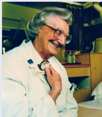
Abb. 1 Dame Cicely Saunders (1918–2005)

Schon vor rund 40 Jahren hat Cicely Saunders die Geburtsstunde der modernen Palliativmedizin und Hospizbewegung eingeläutet