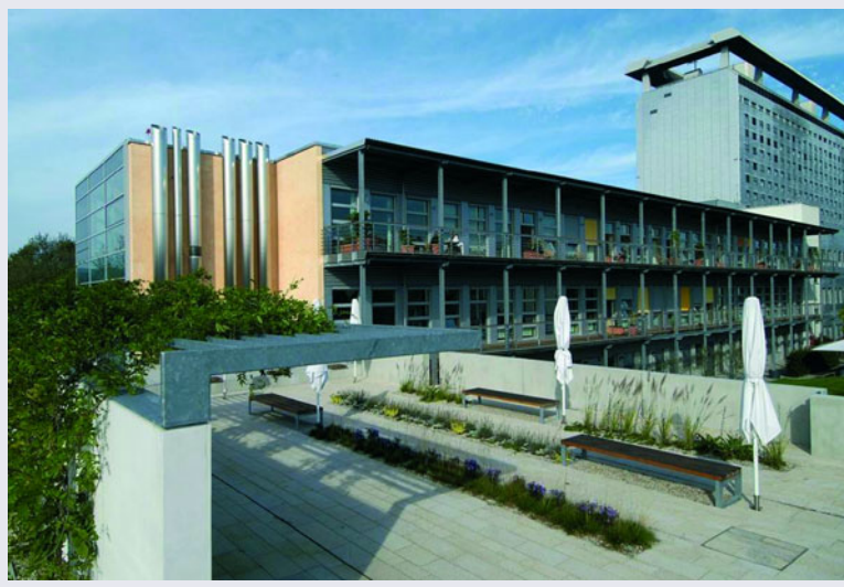
Der Neubau des Interdisziplinären Zentrums für Palliativmedizin des Klinikums der Universität München wurde mit Unterstützung der Deutschen Krebshilfe und des Freistaates Bayern errichtet

liativmedizin hochgradig gefährdet, da sich der hohe Personalaufwand bei der Betreuung schwerstkranker und sterbender Patienten nachweislich nicht im Fallpauschalen(DRG)-System abbilden lässt. Um den Versorgungsstandard nicht absinken zu lassen, ist eine kontinuierliche Einwerbung von Drittmitteln und Spenden notwendig.