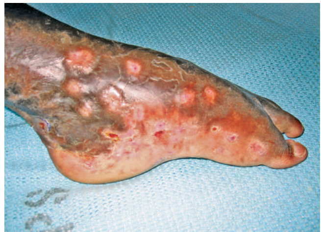
Abb. 3 Fall 2: Linker Fuß eines 28-jährigen Mannes, der bereits seit vielen Jahren an einem Eumyzetom leidet, mit Ketoconazol teilbehandelt. Röntgenologisch zeigte sich eine fortgeschrittene Destruktion des gesamten Sprunggelenkes einschließlich der Malleolargegend, so dass eine Amputation unvermeidlich war.

Das Eumyzetom ist eine tückische, aber vermeidbare Erkrankung. Die Infektion entwickelt sich langsam, über einen langen Zeitraum, ohne Beschwerden, so dass sie zunächst nicht ernst genommen wird. In Ostafrika ist außerdem der Zugang zu einem