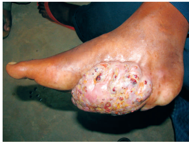
Abb. 1 Fall 1: 36-jährige Patientin mit Riesen-Eumyzetom an der Innenseite des rechten Fußes, seit mehreren Jahren wachsend.

Am 1.2.2006 wurde die Pat. von uns gesehen und erneut stationär aufgenommen. Der gesamte rechte Fuß war zu diesem Zeit-