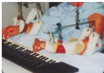
Abb. 3 „reversed Washington-Schiene“ zur ergotherapeutischen Nachbehandlung von Strecksehnenverletzungen: aktive Beugung der Langfinger bei passiver Rückführung der Finger in die Streckstellung.