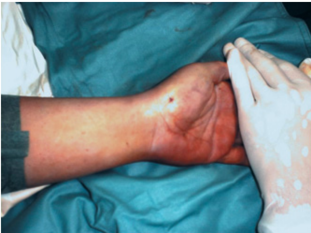
Abb. 6 Hautinzision bei OP-Ende.

werden. Sollte eine solche Rotationsfehlstellung erkannt werden, ist intraoperativ der Umstieg auf das offene Verfahren zwingend notwendig.