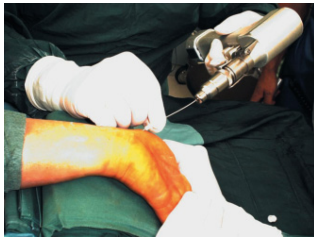
Abb. 2 Einbringen des Zieldrahtes.

Der Vorteil dieser offenen Methode ist, dass dislozierte Skaphoidfrakturen unter Sicht reponiert werden können, auch bei groben Dislokationen ist eine anatomische Reposition der Fraktur unter Aufrichten des interskaphoidalen Winkels möglich. Wenn das Repositionsgig mitbenutzt wird, kann auch hier eine maximale Kompression auf die Fraktur gebracht werden.